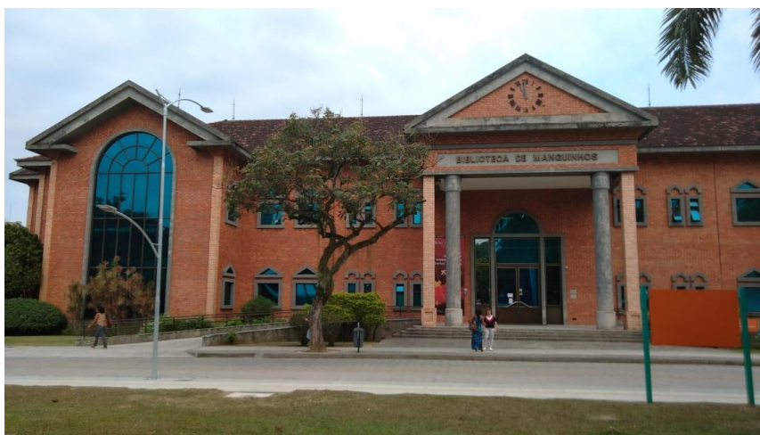
Figura 4: Foto capturada da Biblioteca de Manguinhos

Normalmente, para visitar o local, os funcionários oferecem uma excursão com início no Centro de Recepção com um guia do museu para levar aos estabelecimentos que ali estavam contidos. Mais uma vez, ao perguntá-los sobre o motivo, a intenção era facilitar a orientação da visita, já que o local era muito grande e com isso, é fácil de se perder. Mesmo assim, não era obrigatório seguir a essa excursão, uma vez que somente na primeira visita foi utilizada, durante o segundo dia de visita preferiu-se conhecer as partes do museu isoladamente.