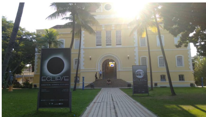
Figura 2: Foto capturada da entrada do MAST