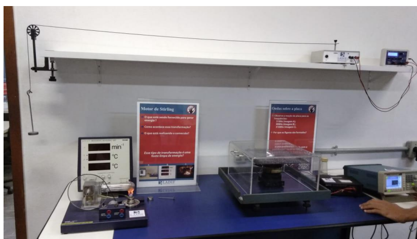
Figura 5: Foto capturada dos experimentos de eletromagnetismo e ondas

Ao serem perguntados sobre as disponibilidades deles, informaram que o laboratório possui vários estagiários que ficam em uma escala, de maneira que sempre fique de dois a três dentro do local para acompanhar os visitantes. Além disso, o Laboratório possui um funcionário específico, responsável para cuidar das necessidades do estabelecimento. E, durante a visita, estava presente auxiliando e respondendo às perguntas que eram feitas sobre o local.