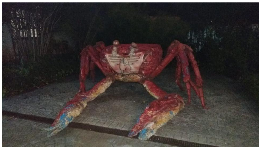
Figura 1: Foto capturada de uma das exposições de reciclagem