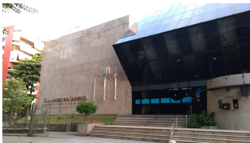
Figura 3: Foto capturada da entrada do Planetário

A visita ocorreu em um dia de semana, e estava acompanhado das pessoas anteriores como já havia falado. A recepção estava de acordo com o que o site explicava: em um primeiro momento era preciso conversar com a atendente do local para comprar os ingressos do museu e feito isso a entrada era liberada. Vale ressaltar que o local tem ótima acessibilidade para pessoas com deficiência física, com rampas e acessórios que podem auxiliar a todos que quisessem ingressar no estabelecimento.