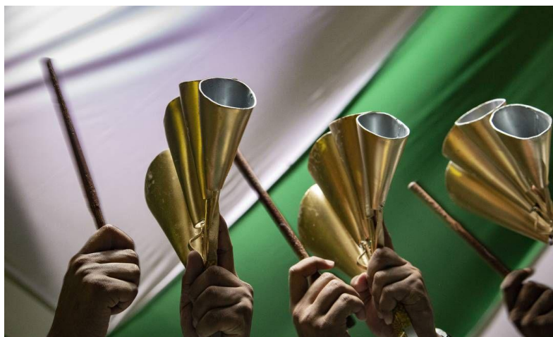
Figura 2 – Agogôs de quatro bocas, instrumento identitário de boa parte das baterias de escola de samba do Subúrbio Carioca.