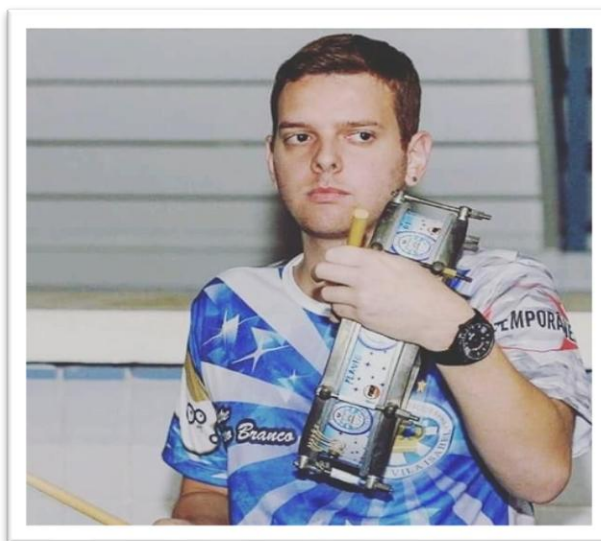
Figura 1 – O autor executando o toque do Tarol, instrumento identitário da Unidos de Vila Isabel.