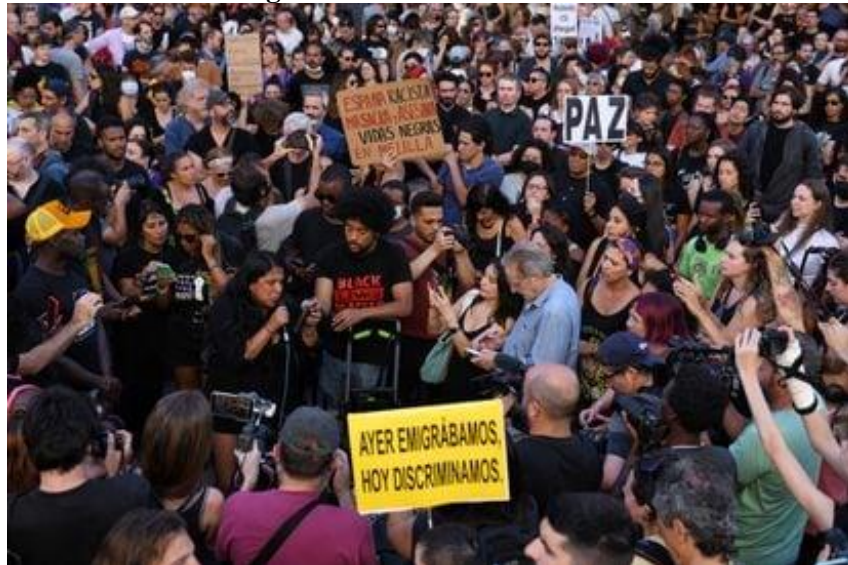
Figura 2 - Protesto em Madrid