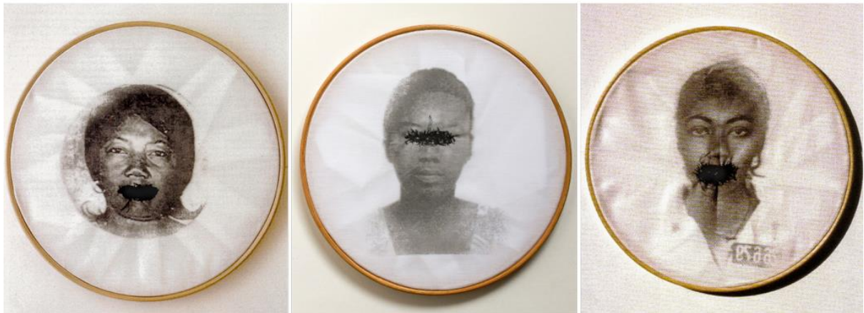
Figura 4 - Obra da série “bastidores” (2019), de Rosana Paulino