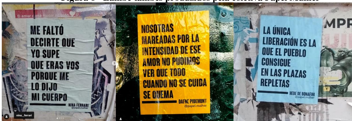
Figura 6 - Lambe-lambes produzidos pela coletiva Papel Mulher

11