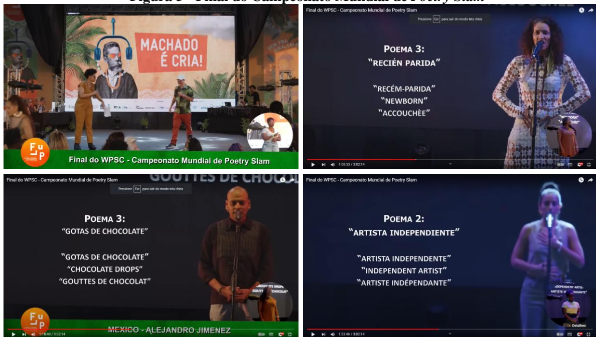
Figura 5 - Final do Campeonato Mundial de Poetry Slam

8