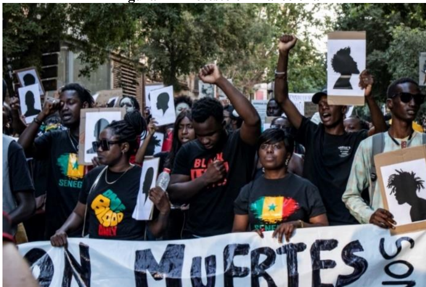
Figura 1 - Protesto em Barcelona

Para iniciarmos o trabalho com poetry slam em sala de aula para turmas de espanhol como língua estrangeira, optamos por selecionar imagens relacionadas às manifestações do Black Lives Matter (Vidas Negras Importam) que ocorreram em 2022, na Espanha, após o Massacre de Melilha, que matou várias dezenas de migrantes da África subsaariana. O episódio impulsionou uma onda de protestos que tomaram as ruas ao redor do país. Dessa forma, os alunos entrarão em contato com uma representação habitual do que consideramos uma manifestação por direitos civis.