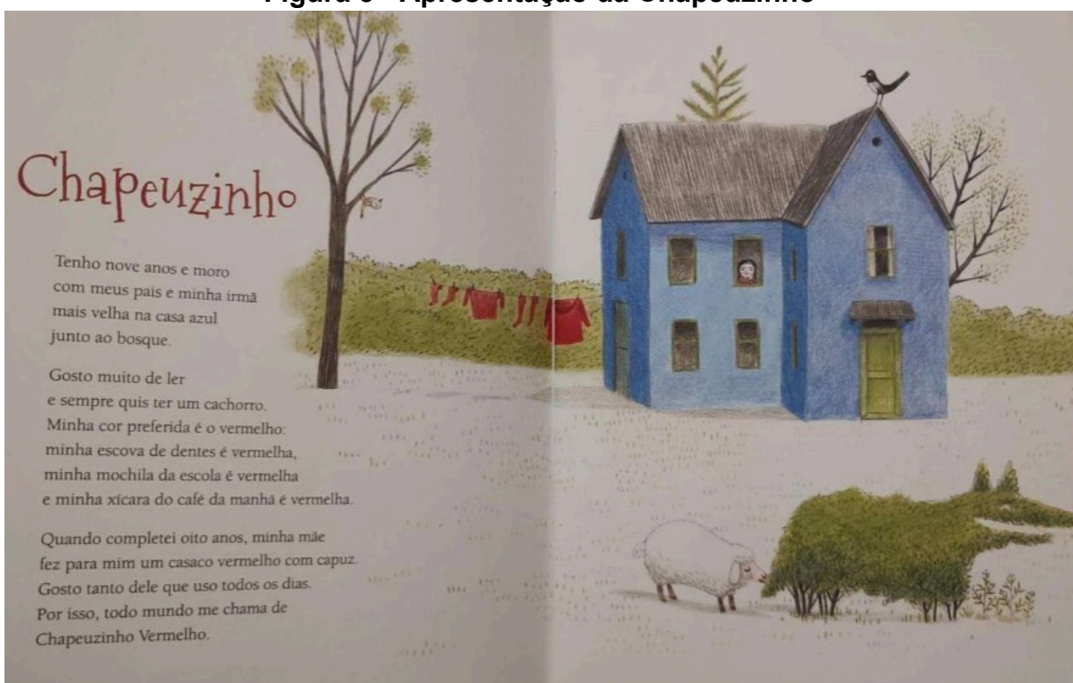
Figura 3 - Apresentação da Chapeuzinho

Dentre as possibilidades de resposta estão trechos do livro: “casa azul junto ao bosque”, “Estava procurando trufas na floresta”, “vale abaixo”, “casa vermelha perto do córrego”, “do alto da colina”, ou observações dos alunos, tais quais: atrás do arbusto em formato de lobo, as árvores da floresta, entre outros. As figuras 3 e 4 abaixo, mostram alguns desses trechos do livro e ilustrações que podem ser usadas como referenciais espaciais pelos estudantes.