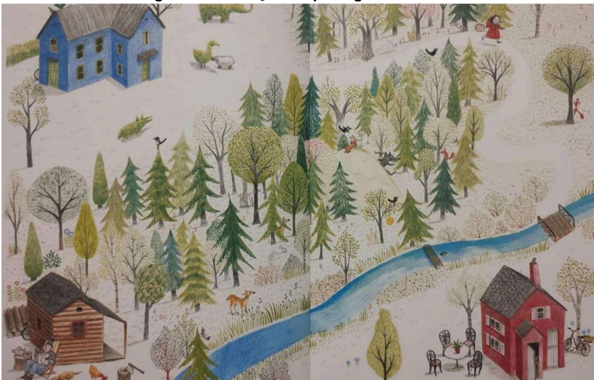
Figura 2: Ilustração da paisagem do conto

Em conjunto com o texto, as variadas ilustrações, incluindo uma ilustração que representa a paisagem onde vivem os personagens (Figura 2 abaixo), adicionam ludicidade ao processo de aquisição da linguagem geográfica e na formação de um aluno leitor de imagens.