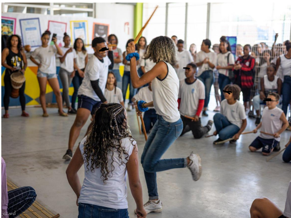
Imagem 4: Alunos e alunas durante a atividade de maculelê na aula de Educação Física

que passar por adaptações, não foi possível contar com um grupo ou um mestre de capoeira por conta do horário das aulas, nós realizamos a roda de capoeira e uma grande surpresa foi a atividade do maculelê. Esta atividade teve bastante adesão e engajamento dos alunos que mesmo depois do fim da sequência didática continuam perguntando quando vamos ter novamente a aula do maculelê. Na imagem segue uma turma que fez a atividade do maculelê: