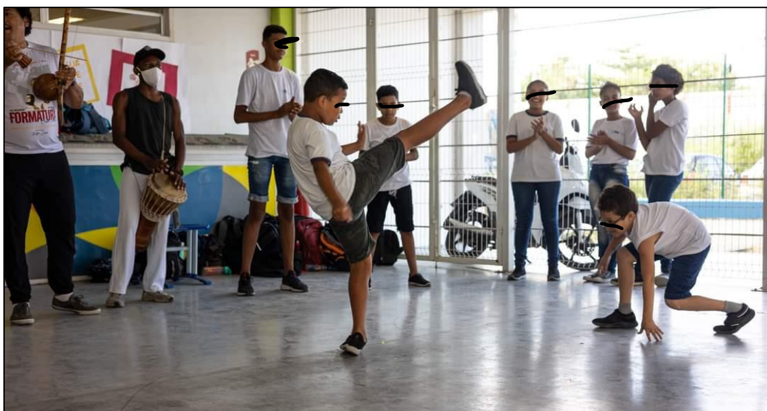
Imagem 2: Alunos participando do momento da roda, no centro da imagem dois alunos realizam o jogo da capoeira.

Ao final da aula a dinâmica era cantar uma música que fala sobre Aidê como uma personagem e o quilombo de camugerê, nenhum dos alunos ou alunas conheciam previamente Aidê e alguns tiveram a dificuldade de pronunciar a palavra Camugerê, foi percebido um avanço das primeiras duas aulas para este encontro onde os alunos realizaram alguns golpes que foram ensinados nestes encontros como podemos ver na imagem 2.