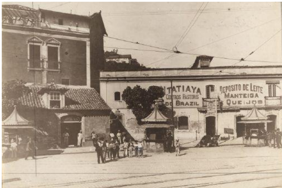
Imagem 4 - Largo da Carioca