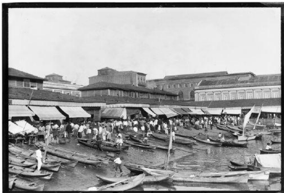
Imagem 2- Doca e Mercado da Praia do Peixe. Praça XV de Novembro.