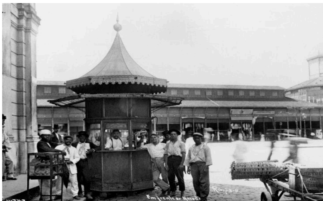
Imagem 3 - Mercado Municipal do Rio de Janeiro. Praça XV de Novembro