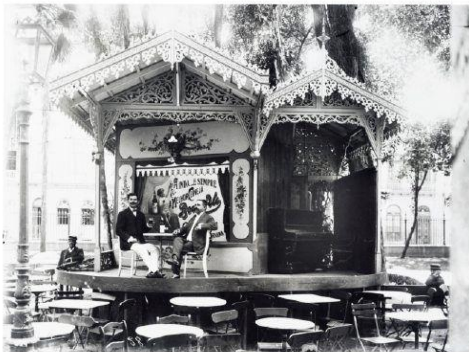
Imagem 6 - Quiosque “Chopp Berrante”, no Passeio Público.

Fonte: Augusto Malta, Rio de Janeiro, 1908. Disponível no acervo do IMS, em : https://acervos.ims.com.br/portals/#/detailpage/16031