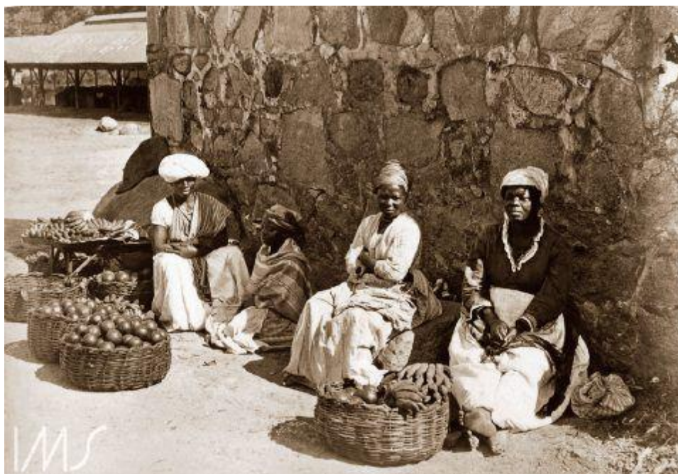
Imagem 5 - Quitandeiras