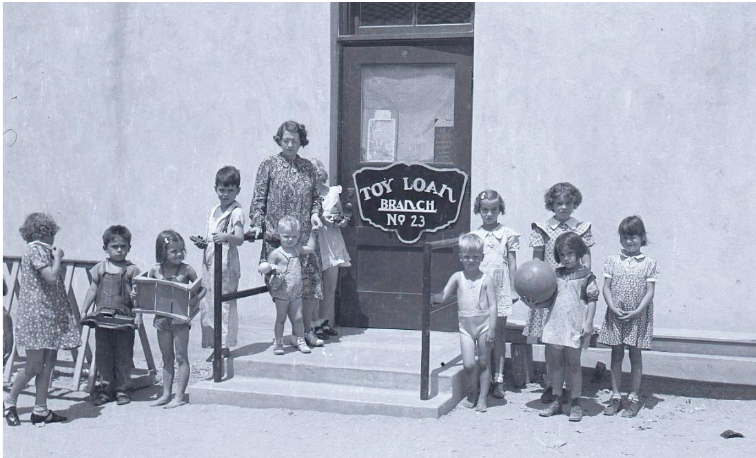
Fotografia 1 – Primeira ToyLoan criada em Los Angeles em 1934.