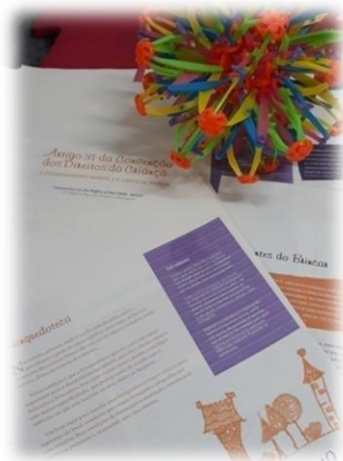
Fotografia 2: Artigo 31