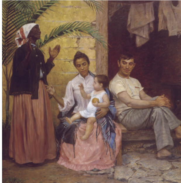
Figura 4 - A Redenção de Cã, Modesto Brocos, 1895.