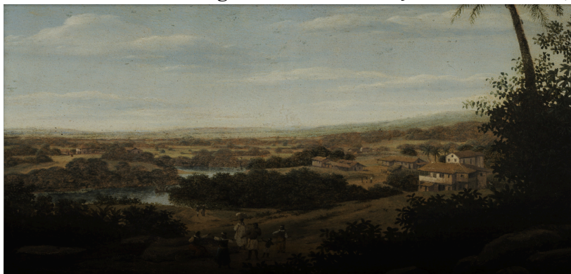
Figura 2 - Vista de um engenho de cana de açúcar. Frans Post, 1637-1680.

Fonte: Catálogo da exposição "Das Galés as Galerias", 2019.