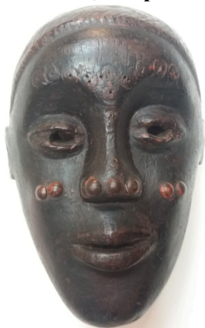
Figura 1 - Máscara Ritual, Grupo Cultural Benin, [s.d]