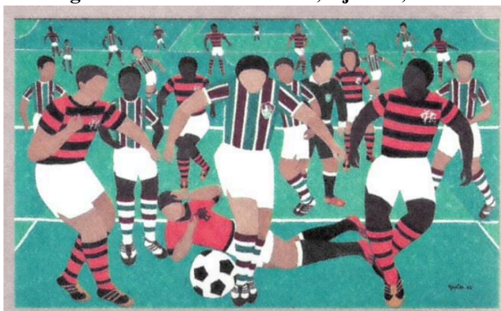
Figura 5 - Futebol: Fla - Flu, Djanira, 1975.