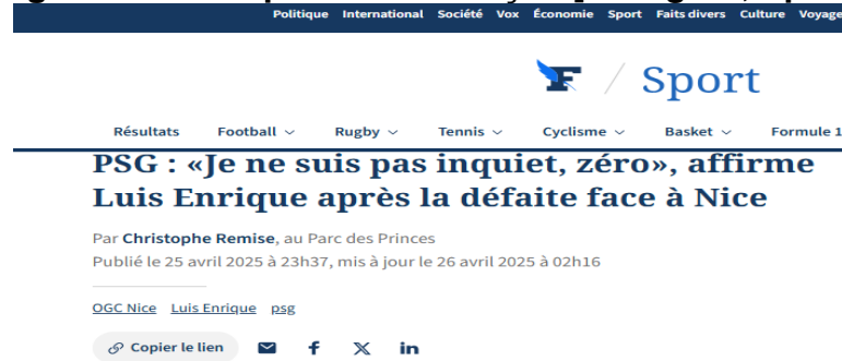
Figura 3 – Exemplo de Declaração [Le Figaro, Sport]