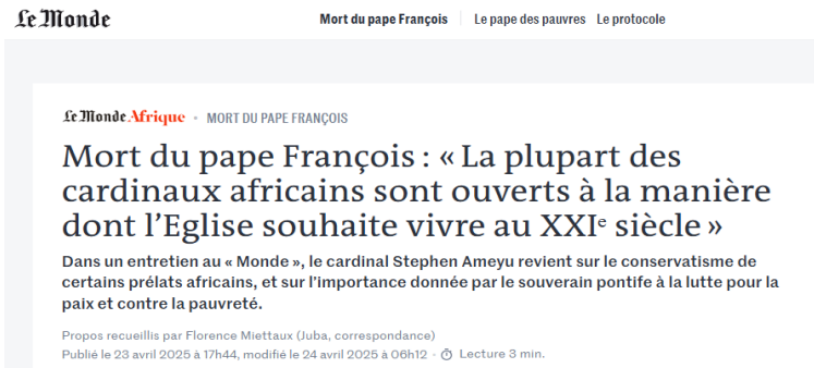
Figura 5 – Exemplo de Desejo [Le Monde Afrique, Article]