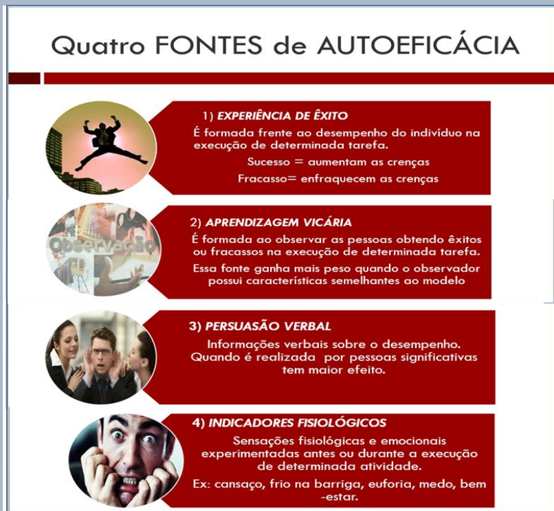
Figura 1: Fontes de autoeficácia