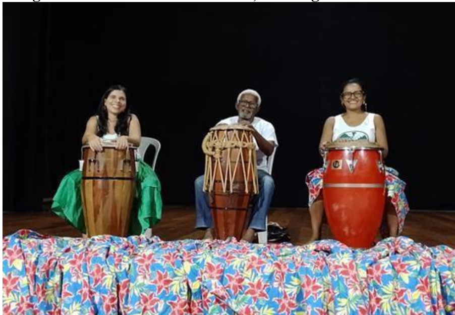
Imagem 3 - Os três tambores tambu, candongueiro e o caxambu

A formação do Morro da Serrinha seguiu um processo semelhante ao de outros morros cariocas. Após a abolição da escravidão, em 1888, muitas famílias de ex-escravizados se estabeleceram próximas à área portuária do Rio de Janeiro. Com a política do " bota-abaixo ", implementada pelo prefeito Pereira Passos (1902-1906) no início do século XX, cortiços e habitações populares foram demolidos, forçando a população negra e pobre a buscar moradia nos morros e áreas periféricas da cidade. Forçada a deixar o centro da cidade, a população negra e pobre se deslocou para os morros, incluindo a Serrinha, no bairro de Madureira.