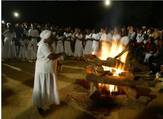
Imagem 2 - Roda de jongo e fogueira no Quilombo José da Serra