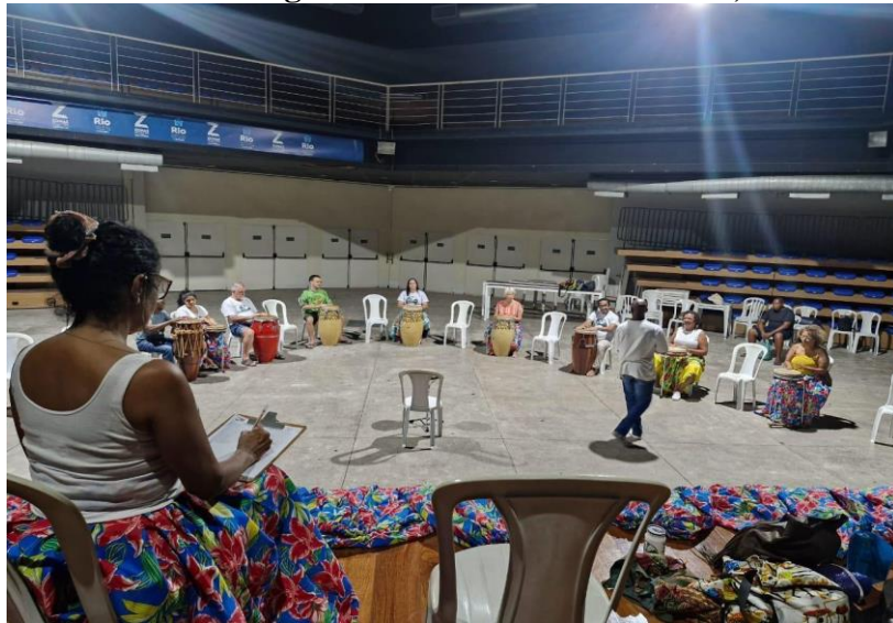
Imagem 8 – Aula de Jongo na Arena Fernando Torres, em Madureira

A Escola de Jongo tem se consolidado como um espaço fundamental para a preservação cultural e para a formação socioeducativa de crianças e adolescentes da comunidade de Madureira e arredores. Com 23 anos de história, a escola desenvolve atividades que vão além da educação formal, promovendo a valorização das culturas de matriz africana e contribuindo para a formação integral dos jovens.