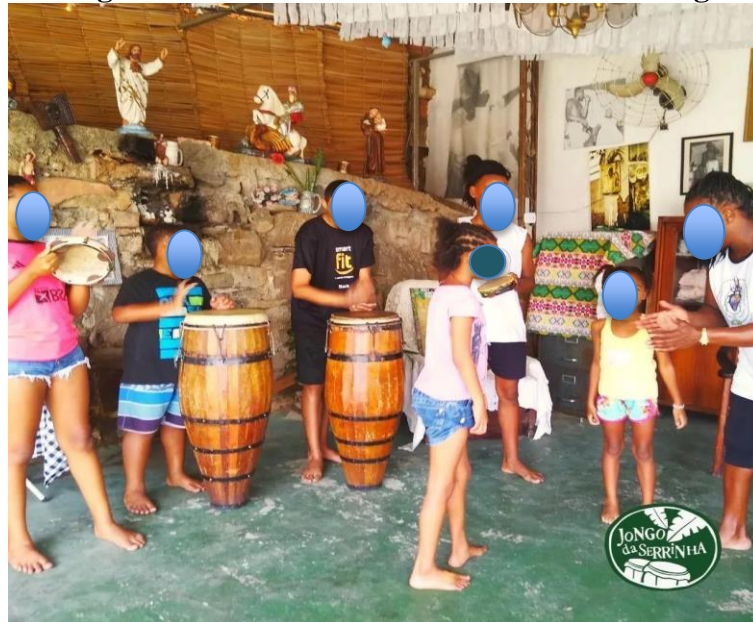
Imagem 10 – Aula de Percussão na Casa do Jongo