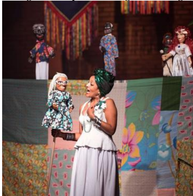
Imagem 9 – Espetáculo Jongo Mamulengo