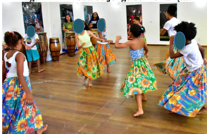
Imagem 11 – Roda de jongo com crianças.