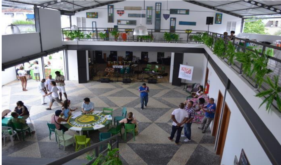
Imagem 7 – Casa do Jongo, Morro da Serrinha – Madureira, Rio de Janeiro/RJ