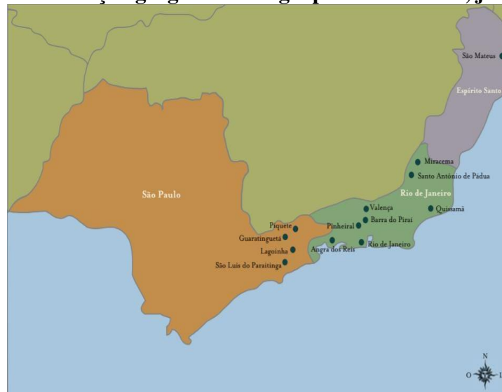
Mapa 1 – Distribuição geográfica dos grupos de caxambu, jongo e tambor