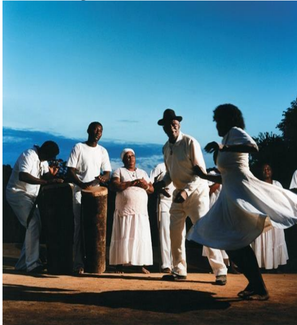
Imagem 1 – Roda de Jongo no Quilombo São José da Serra, Valença-RJ