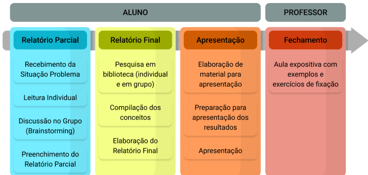
Imagem 1 – Passo a passo da aplicação da ABP para alunos e professores: