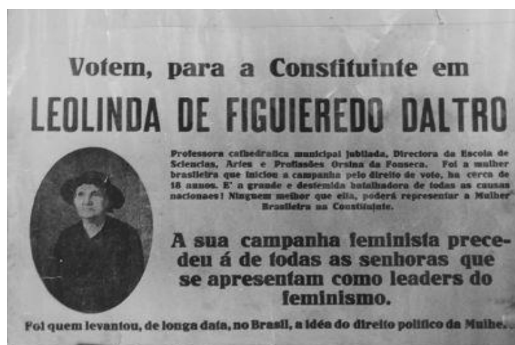
Figura 3: Panfleto da campanha eleitoral de Leolinda de Figueiredo Dalto, para o cargo de Deputada Federal Constituinte em 1933