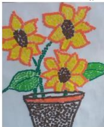
Figura 2 – Releitura de Van Gogh em mosaico