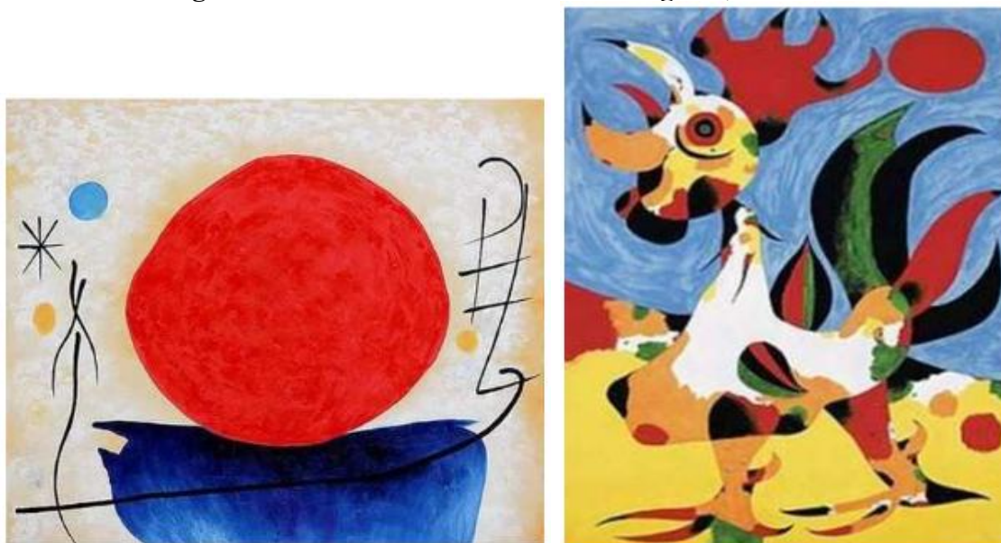
Figura 11 – Obras “Sol vermelho” e “O galo”, de Juan Miró

Fonte: Martins e Mattos (2021, p. 2213-2214)