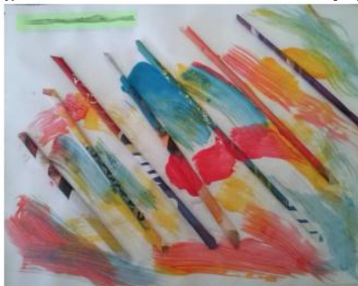
Figura 6 – Pintura sobre canudos de papel