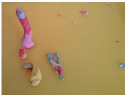
Figura 7 – Modelagem com massinha escolar

Uma atividade vastamente utilizada é a modelagem com massinha para trabalhar os aspectos de dimensão, permitindo que as crianças realizem representações bidimensionais com técnicas de perspectivas, utilizando tonalidades diferentes para efeitos de luz e sombra. A Figura 7 demonstra a atividade de dimensão realizada por um aluno de 3 anos, com auxílio de massinha de modelar. Segundo Ferreira (2015, p. 34) esta prática se destacou, uma vez que esta “desenvolve a motricidade fina, a observação, formulação de hipóteses, a percepção de quantidade de massa, a representação por meio da manipulação da mesma, possibilita a descoberta de novas formas, cores, combinações, diferentes texturas e movimentos”.