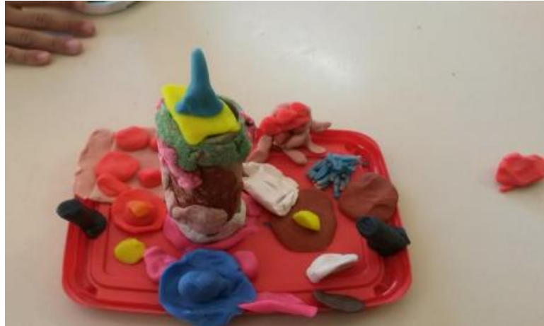
Figura 8 – Casa na árvore feita com massinha de modelar

A Figura 8 mostra a casa na árvore, uma das modelagens feitas pelos alunos: