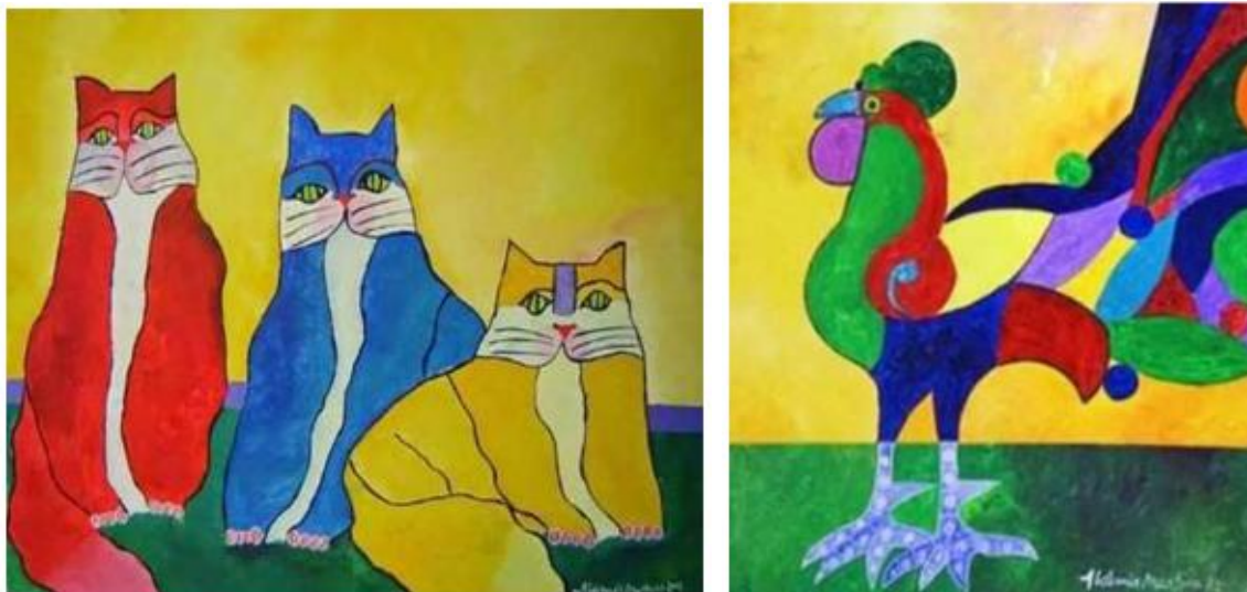
Figura 10 – Obras “Família de gatos” e “O galo”, de Aldemir Martins

Fonte: Martins e Mattos (2021, p. 2213-2214)