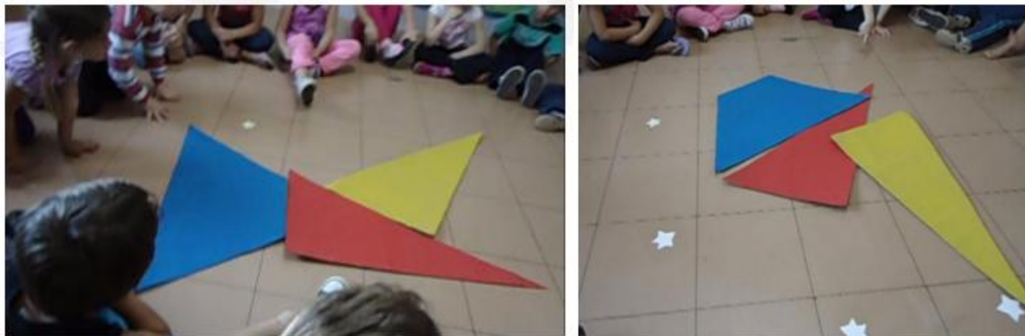
Figura 9 – Partes geométricas transformadas em peixe e ponte

ao serem agrupadas poderiam se transformar em vários outros elementos como pássaro, peixe e fonte (Figura 9). Após esta dinâmica, as crianças se direcionaram para fora da sala de aula, visualizando o ambiente exterior e identificando formas iguais e cores que compunham o local.