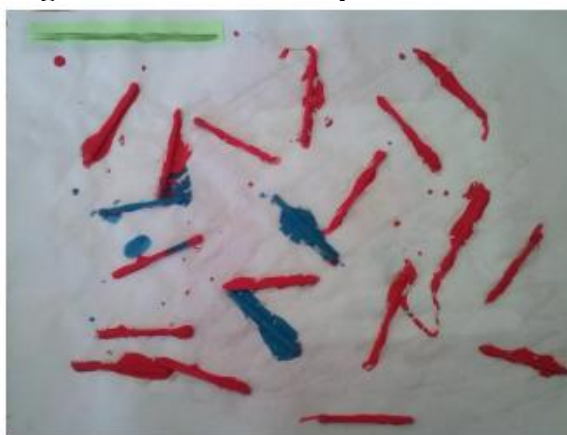
Figura 3 – Pintura com palitos de fósforo

A Figura 3 demonstra uma atividade cujo objetivo foi criar uma pintura com palitos de fósforos, trabalhando as possibilidades com as linhas, definidas como elementos que possuem propósitos e direções, podendo ser adotadas de modo flexível. Ferreira (2015) cita que outros materiais podem ser utilizados para trabalhar as linhas nas Artes Visuais como barbantes, desenho livre, desenhos a partir de objetos como garfos e colagem. Neste tipo de atividade, os alunos permanecem livres para alterarem as cores, realizarem traçados de tamanhos diferentes e utilizarem a imaginação como desejarem.