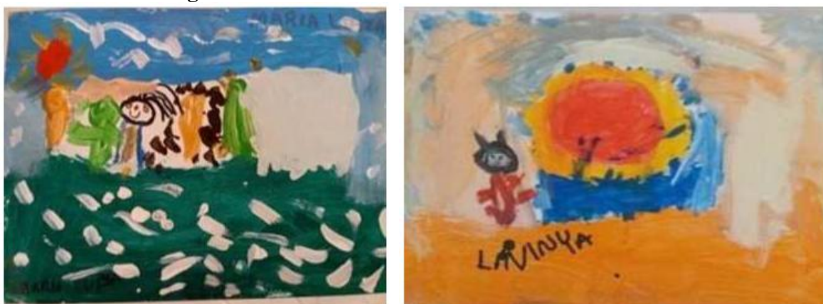
Figura 12 – Pinturas baseadas nas obras de artistas

Após a apresentação dessas obras e a discussão dos elementos visuais, a professora disponibilizou diferentes materiais, de livre escolha, para que as crianças pudessem pintar como desejassem suas obras baseados nos debates em sala de aula. As imagens dos artistas permaneceram todo o tempo expostas para que as crianças pudessem olhar quando necessário. Os materiais disponibilizados foram papel sulfite, papelão, papel cartão, pinceis, tinta, canetinha, lápis de cor e cola colorida. Nenhuma criança escolheu papel sulfite, optando por materiais diferentes, sendo que a maioria utilizou pincel e tinta. A Figura 12 mostra as pinturas realizadas por dois alunos: