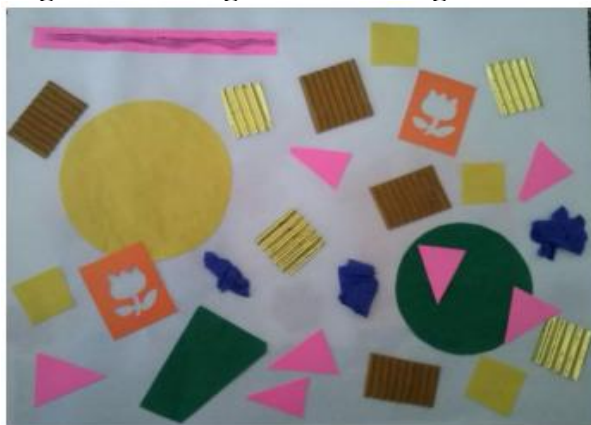
Figura 4 – Colagem de formas geométricas