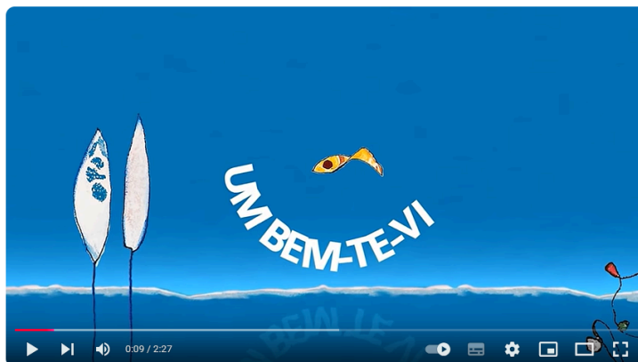
Figura 4 - Vídeo “Um bem-te-vi”, Projeto Crianceiras

Fonte: Canal “Projeto Crianceiras”, YouTube. Acesso em maio de 2025.