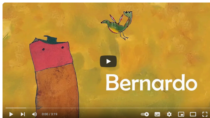
Figura 2 - Vídeo “Bernardo”, Projeto Crianceiras.