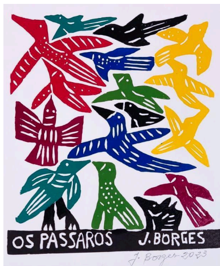
Figura 5 – “Os pássaros”, J. Borges (2023)