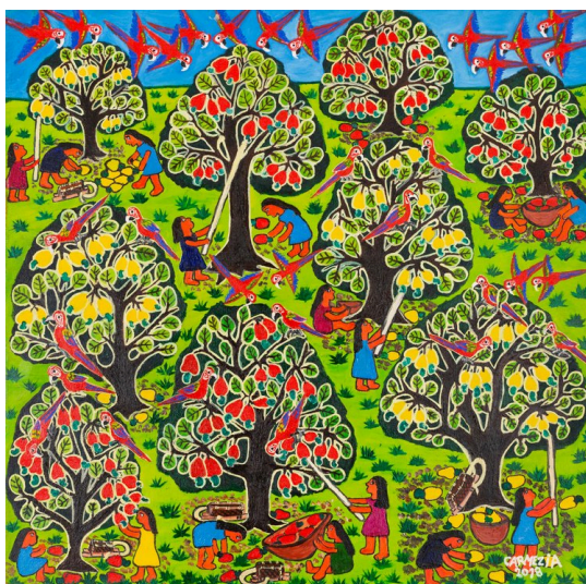
Figura 3 – “Araras”, Carmézia Emiliano (2018)