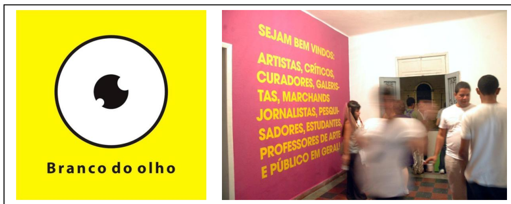
Figuras 3 e 4 – Desenho (logotipo) do Coletivo e Exposição (2009)