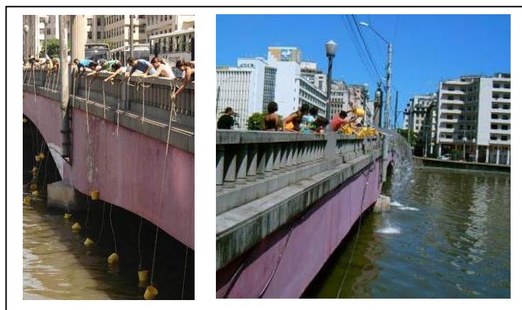
Figuras 1 e 2 – Manta do Rio – Marcos Costa

Fontes: COLLIER, Bárbara, 2018 e Revista Digital Canal Contemporâneo 2 , 2005.