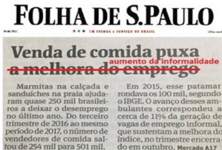
Figura 1 – Manchete do jornal Folha de S. Paulo do dia 09/01/2018 reescrita