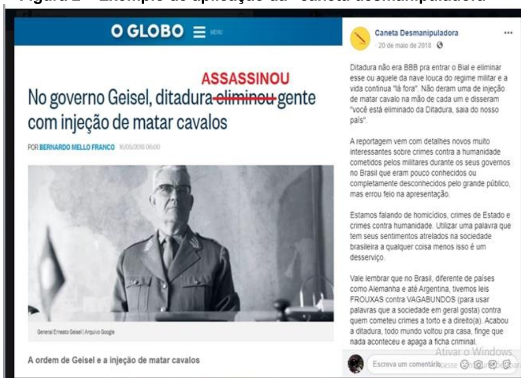
Figura 2 – Exemplo de aplicação da “caneta desmanipuladora”