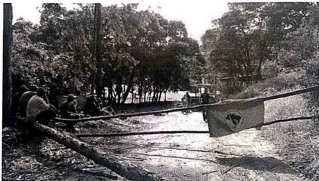
MST invadiu fazendas em quatro Estados nesta terça-feira