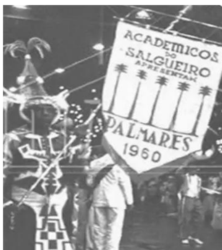
Figura 5, 6: Carnaval de 1960, Quilombo dos Palmares