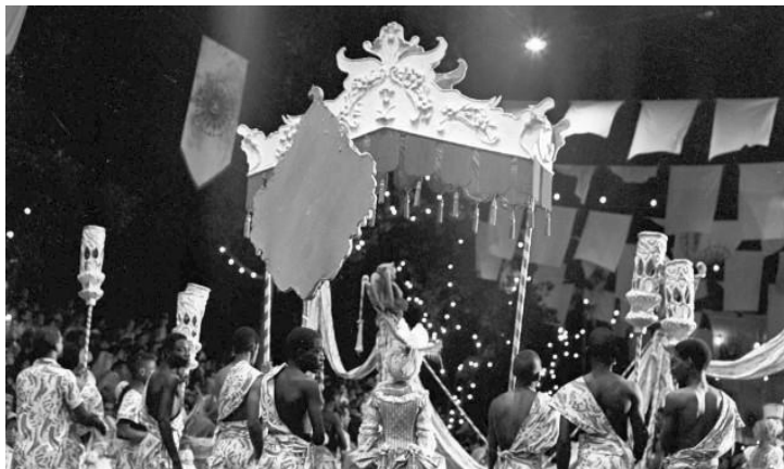
Figura 7 e 8: Carnaval de 1961, Vida e Obra de Aleijadinho.