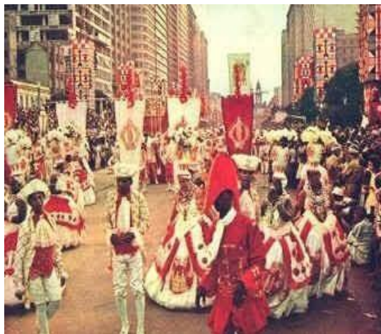
Figura 11 e 12: Carnaval de 1964, Chico Rei