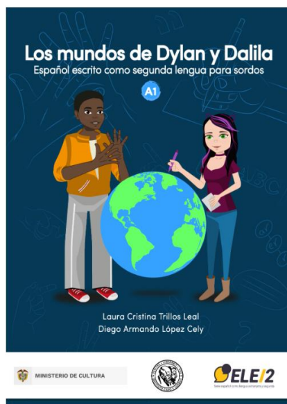
Figura 7 - Los mundos de Dylan e Dalila - Español escrito como segunda lengua para sordos Nivel A1 (Capa)

Abaixo, na Figura 7, temos a capa do livro.