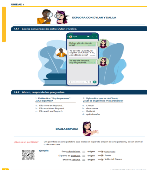
Figura 8 – Lección 1, Unidad 1 – Dylan y Dalila