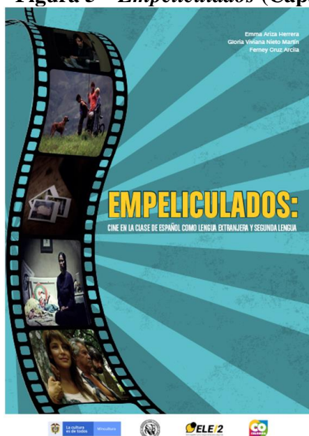
Figura 5 – Empeliculados (Capa)

Abaixo, na Figura 5, temos a capa do material didático.