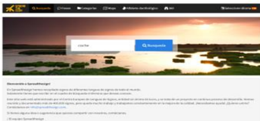
Figura 3 – Spreadthesign (Site do Dicionário de Língua de Sinais)