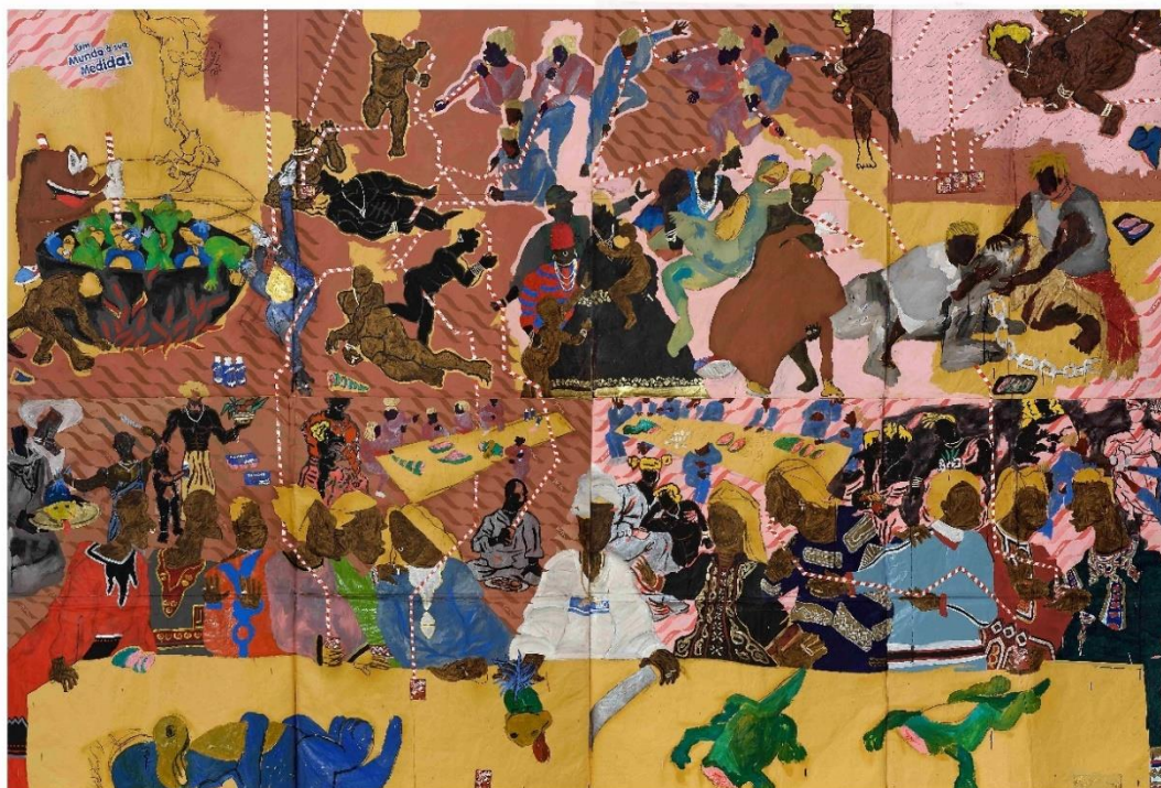
Figura 9: Maxwell Alexandre, “Não foi pedindo licença que chegamos até aqui”, Série Pardo é papel , 2018.

Apesar de remeter ao período da Copa e das Olimpíadas realizadas no Brasil, a referência não evoca memória nos alunos mais jovens. Uma vez que eles não vivenciaram as manifestações da época. No entanto, ao serem explicados sobre a interação diferenciada com as forças de segurança entre os frequentadores dos estádios e as operações e ocupações em favelas, os alunos tendem a compreender. E fazem associações a momentos e situações mais próximos de suas realidades.