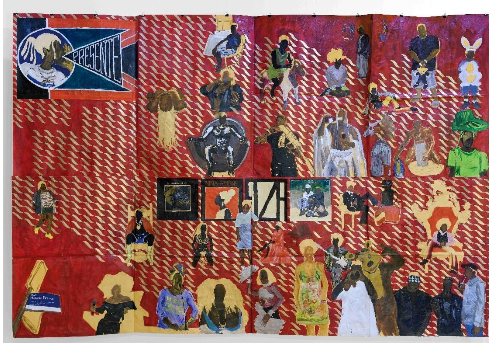
Figura 13: Maxwell Alexandre, “Cantos de Esquinas”, Série Pardo é papel , 2019.