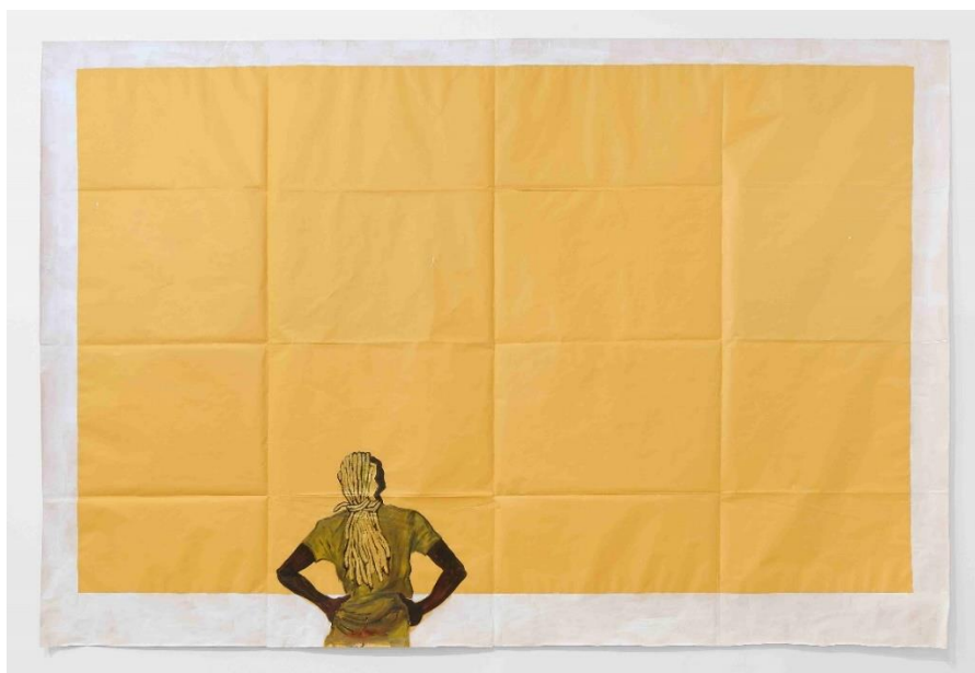
Figura 18: Maxwell Alexandre, “Sem título II”, Série Novo Poder , Série Pardo é papel , 2019.