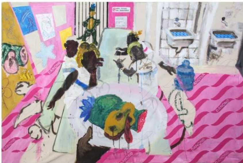
Figura 11: Maxwell Alexandre, “Merenda”, Série Pardo é papel , 2018.

Crianças uniformizadas e com elementos típicos de datas comemorativas como “Dia do Índio” e “Dia do Soldado”, ao fundo, os golfinhos do emblema da cidade do Rio de Janeiro. Em uma referência a crianças saindo das escolas fantasiados em datas comemorativas, a tela cria rápida identificação com os alunos. Possibilita dialogar sobre as datas comemorativas e o questionamento a sair “fantasiado de índio” da escola, sobre as representações habituais e os estereótipos construídos dos indígenas.