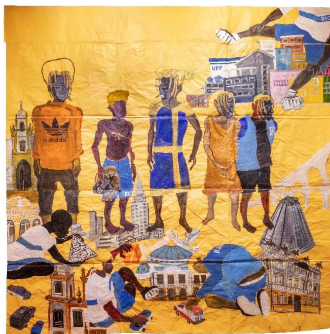
Figura 14: Maxwell Alexandre, “Crianças atrás de telas”, Série Reprovados-Pardo é papel , 2018.

A riqueza dessa obra impressiona tanto quem consegue identificar e descobrir referências, como quem é jovem e não possui repertório para perceber as homenagens presentes na tela. Em geral, os alunos ficam interessados, pois, ao identificar rappers e MCs na imagem, demonstram curiosidade para saber quem são os artistas que não conhecem, saber o que cantam ou fazem.