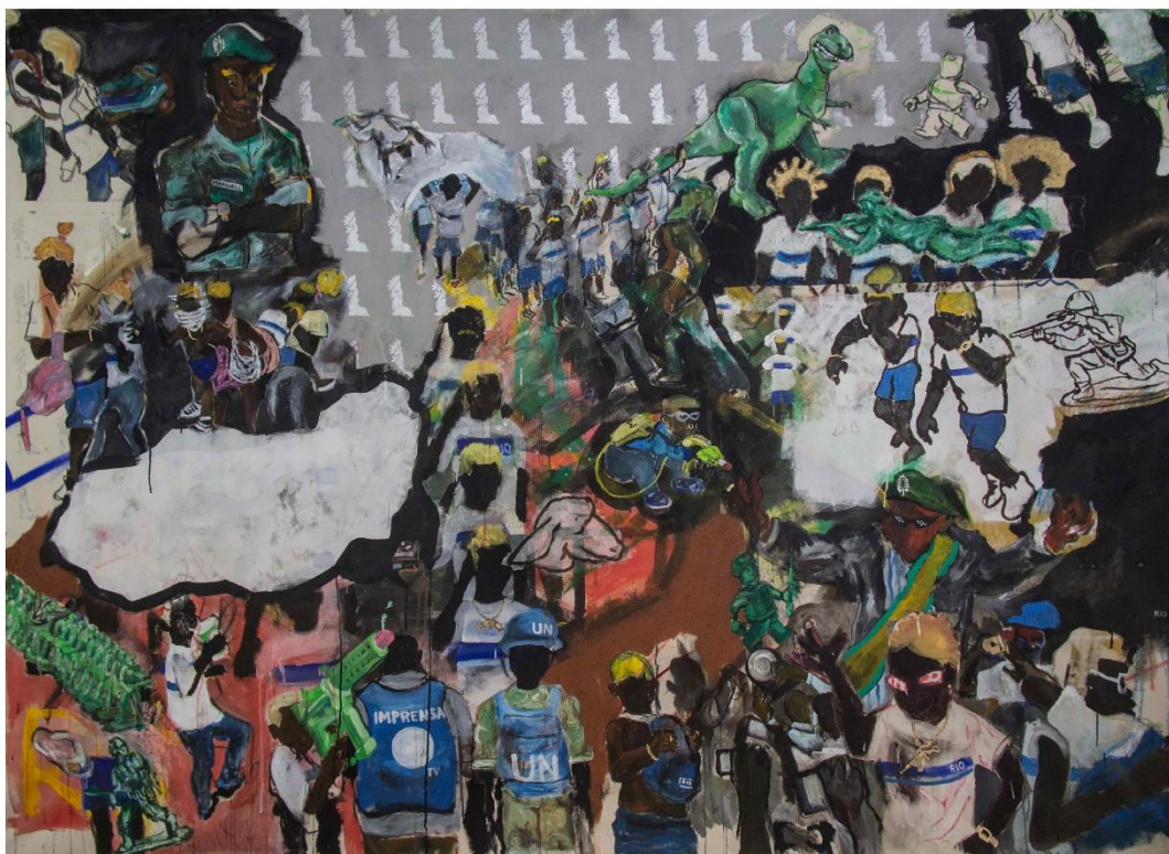
Figura 7: Maxwell Alexandre, “E para salvar o país, Cristo é um ex-militar”, Série Pardo é papel , 2018.

É uma obra que desperta muito interesse quando apresentada aos alunos. Nela os alunos conseguem identificar referências a marcas de luxo. Comemoram a presença de uniformes da rede municipal sendo usados como roupas de grife. E fazem uma intensa associação a situações de inveja, tema que pode ser debatido e explorado.