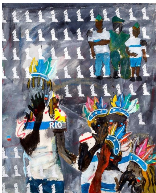
Figura 10: Maxwell Alexandre, “Cabeça de papel”, Série Pardo é papel , 2018.

Essa obra possibilita uma boa discussão sobre religiosidade e as formas como Jesus Cristo e os apóstolos costumam ser representados, uma chance de refletir sobre a construção imagética no imaginário coletivo.