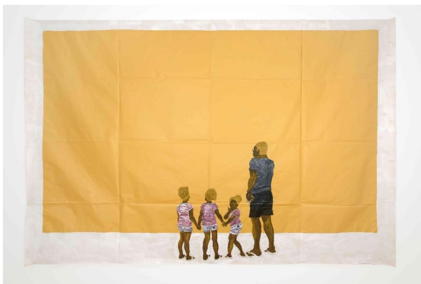
Figura 17: Maxwell Alexandre, “Sem título I”, Série Novo Poder , Série Pardo é papel , 2019.

para que, ao observar, o próprio observador constitua a obra. Novamente, há uma incitação a quem vê: refletir porque geralmente quem consome e quem é representado nas artes não é negro.