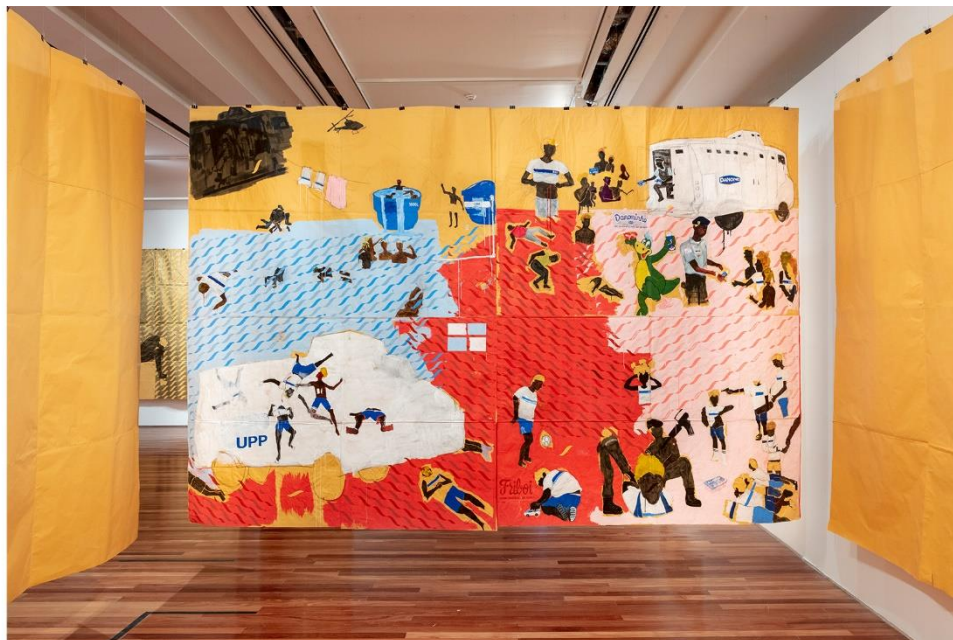
Figura 3: Maxwell Alexandre, “Tão saudável quanto um carinho”, Série Reprovados , 2017.

A série Reprovados recebe esse nome, pois representa aqueles que comumente são reprovados pela sociedade, vistos como possíveis fracassos, por isso, a escolha em utilizar o uniforme de estudantes do município do Rio de Janeiro.