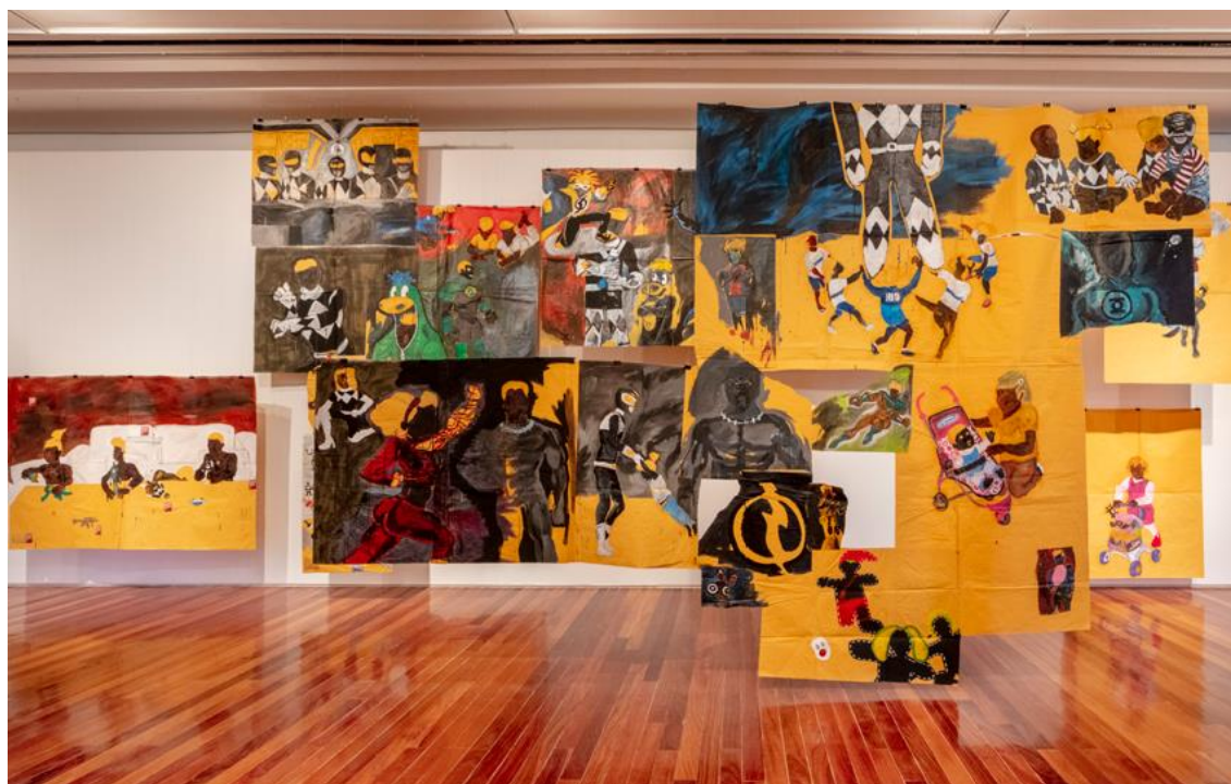
Figura 15: Maxwell Alexandre, “Megazord só de Power Ranger preto”, Série Pardo é papel , 2019.

Na aplicação da oficina, alguns alunos conseguiram apontar locais da cidade que já visitaram. A discussão ficou por conta do título da obra “Crianças atrás de telas”, ao ponderarem sobre o menor acesso à rua como espaço para brincar, o que vem sendo substituído por telas de celulares.