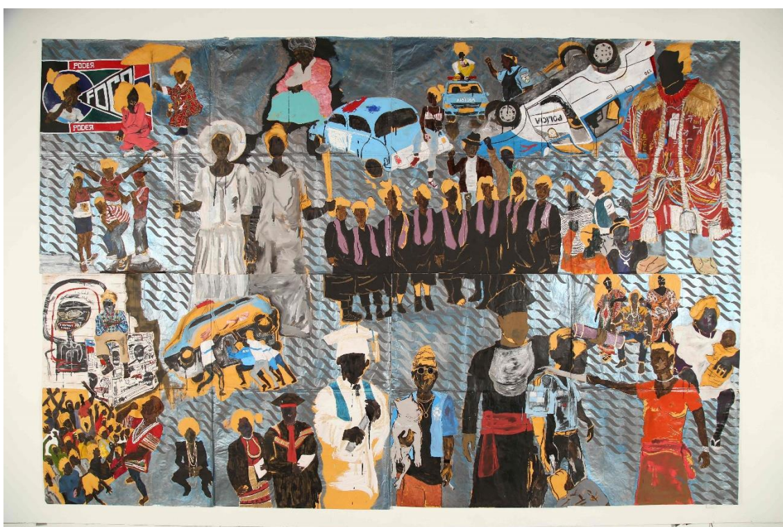
Figura 4: Maxwell Alexandre, “Éramos as cinzas e agora somos o fogo”, Série Pardo é papel , 2018.

Seguem a seguir algumas obras da série Pardo é papel , juntamente com trechos dos raps que serviram de inspiração ao artista. Muitas letras desses raps contêm letras com palavrões, vale ressaltar que se o professor decidir apresentar a tela com a música inspiração, para evitar contratempos, pode ser feita uma seleção de trechos que considere pertinentes para a discussão da tela.