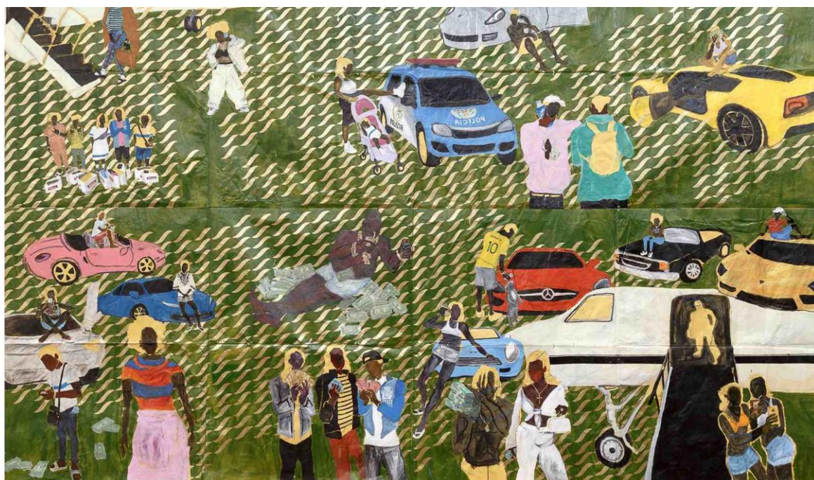
Figura 6: Maxwell Alexandre, “Só quando tu tá com as folhas, geral gosta de salada”, Série Pardo é papel , 2018.

São peças que impactam os estudantes ao conseguirem identificar cenas de clipes e artistas que admiram. A cena de jovens uniformizados virando o carro da polícia possibilita diálogos que buscam a reflexão do que motivou essa representação nas obras. As figuras religiosas, as becas dos universitários e os cabelos descoloridos costumam trazer imediata identificação dos estudantes.