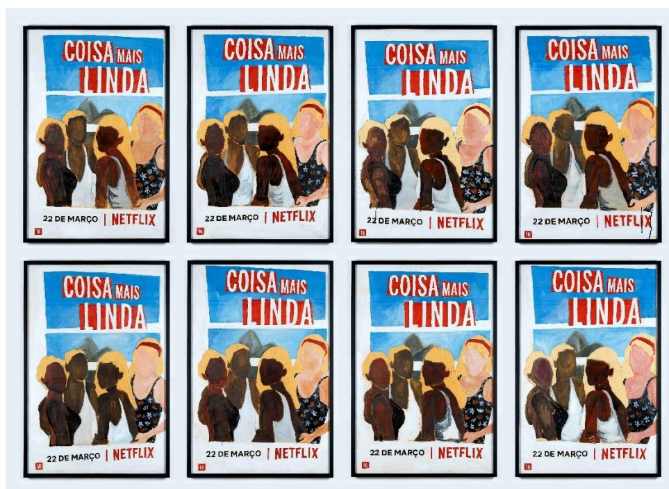
Figura 16: Maxwell Alexandre, “Sem título”, Série Pardo é papel , 2019.