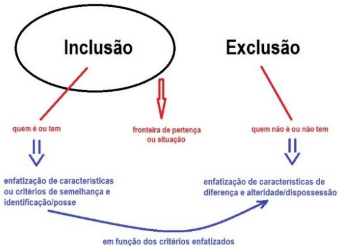
Figura 1: Diagrama da inclusão x exclusão

NAPNE; Algumas informações relevantes a partir de uma pesquisa