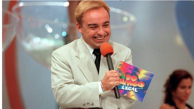
Figura 4- Domingo legal com Gugu Liberato, em 1997