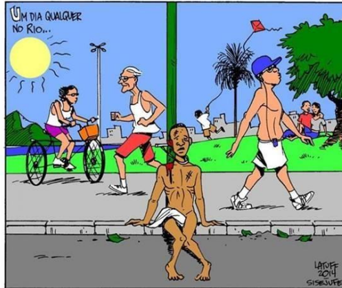
Figura 10 - Um menino negro martirizado