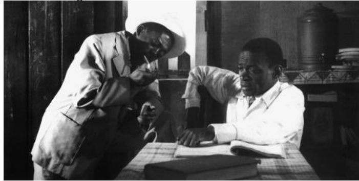
Figura 11 - Também somos irmãos (1947)