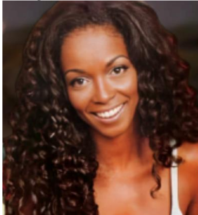
Figura 22 - Atriz Luiza Avellar