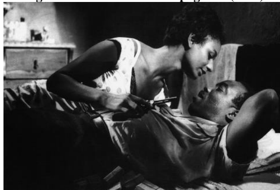
Figura 15 - Assalto ao trem pagador (1962)