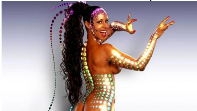
Figura 18 - Valeria Valença ficou muito conhecida por ter sido a Globeleza

Fonte: DCM (Diário do Centro do Mundo) 38 .