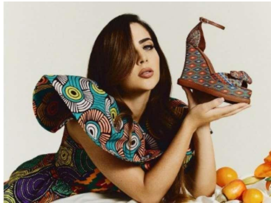
Figura 23 - Jade foi a modelo escolhida para usar peça inspirada em elementos da cultura africana

Entretanto é a artista Jade Picon a modelo escolhida para vestir essa ancestralidade, o que tem gerado comentários por parte dos seguidores da marca. Algumas seguidoras apenas comentam as publicações em que Jade aparece com o ícone de palhaço. Outra chegou a comentar que: “Jade Picon como garota propaganda foi um tiro no pé!”, disse a seguidora 51 .