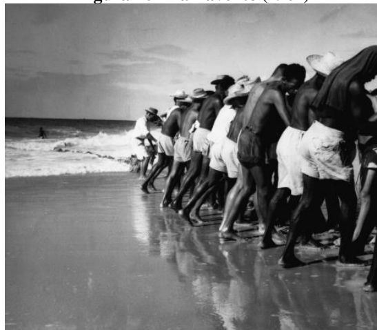
Figura 16 - Barravento (1961)