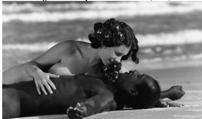
Figura 13 - O poeta do desterro (1999)