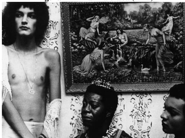
Figura 12- A rainha diaba (1975)