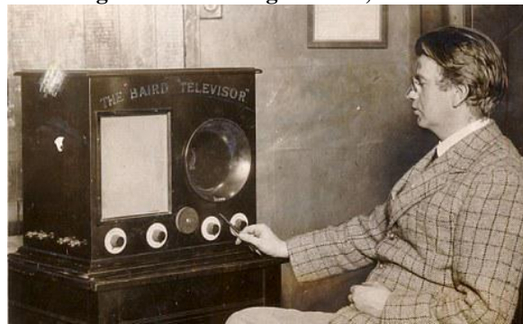
Figura 1 - John Logie Baird , em 1924