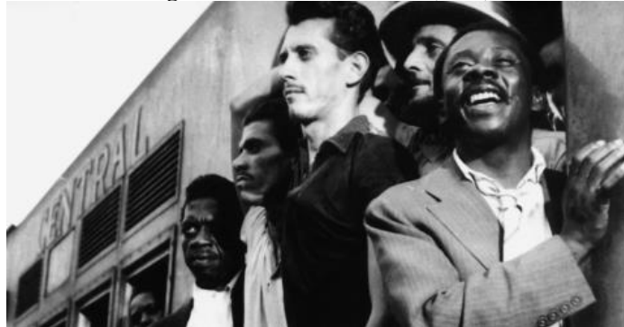
Figura 14 - Rio Zona Norte (1957)