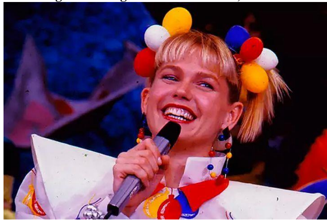
Figura 5- Programa Xou da Xuxa, em 1993