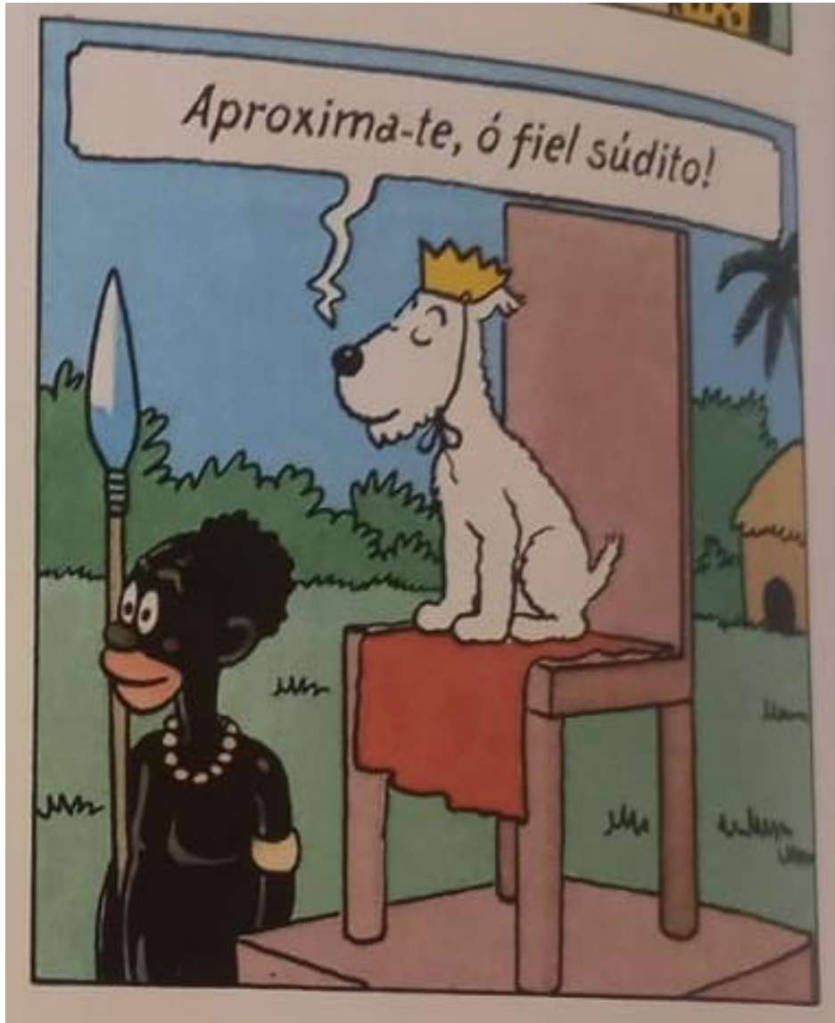
Figura 18 – Milu sentado no trono dos pigmeus.

Fonte: Hergé, 1907-1983. Tintim no Congo (As aventuras de Tintim). 2008. p. 50.