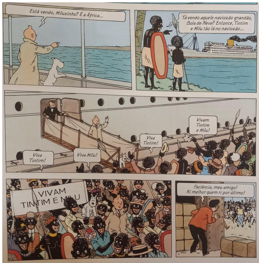
Figura 9 – Tintim chega à África e é recebido calorosamente pelos nativos.

Fonte: Hergé, 1907-1983. Tintim no Congo (As aventuras de Tintim). 2008. p.9.