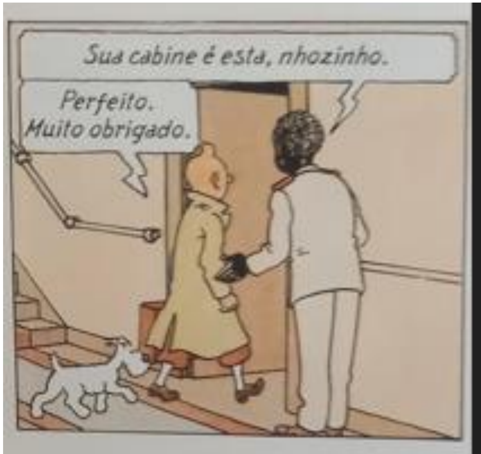
Figura 7 – Tintim e o camareiro.

Fonte: Hergé, 1907-1983. Tintim no Congo (As aventuras de Tintim). 2008. p.1