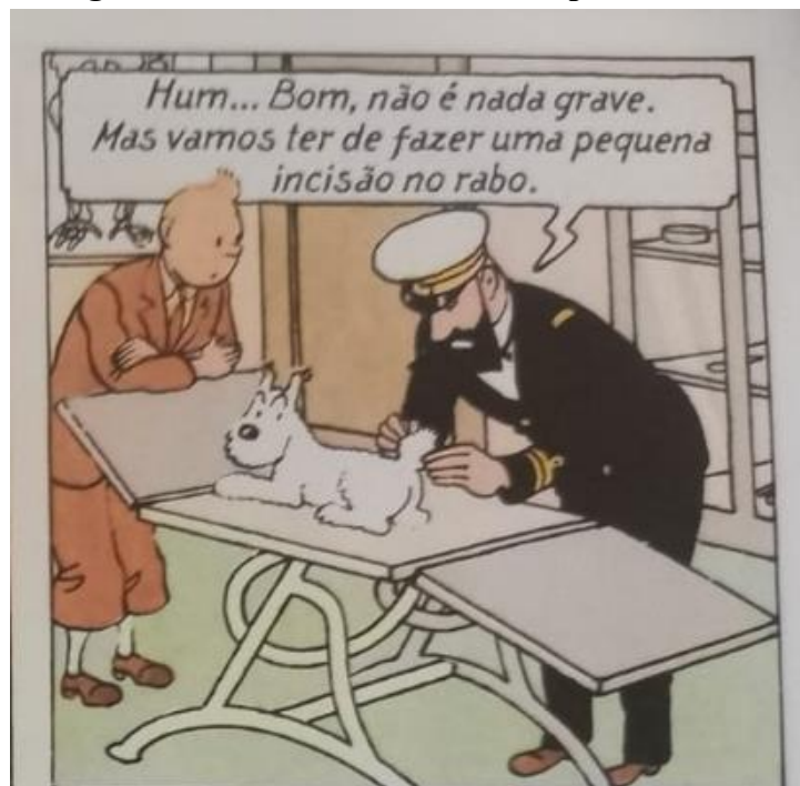
Figura 8 – Milu sendo examinado pelo oficial branco

Fonte: Hergé, 1907-1983. Tintim no Congo (As aventuras de Tintim). 2008. p.4.