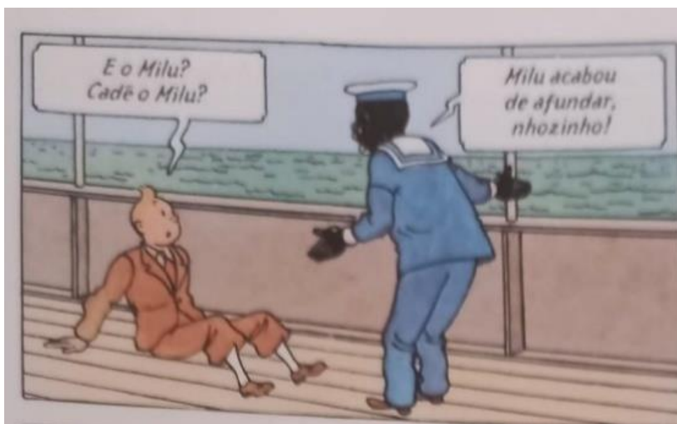
Figura 5 – Marujo negro conversa com Tintim.

Fonte: Hergé, 1907-1983. Tintim no Congo (As aventuras de Tintim). 2008. p. 3.