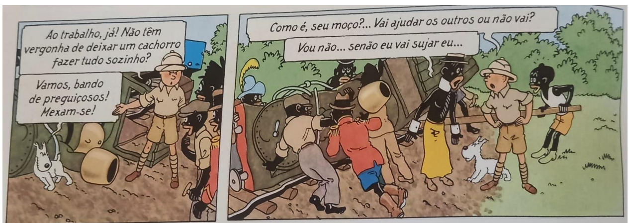
Figura 13 – Tintim dando ordem para os negros consertarem o trem

Fonte: Hergé, 1907-1983. Tintim no Congo (As aventuras de Tintim). 2008. p. 20.