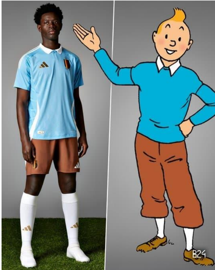
Figura 3 – Uniforme belga de 2024 inspirado nas roupas de Tintim.