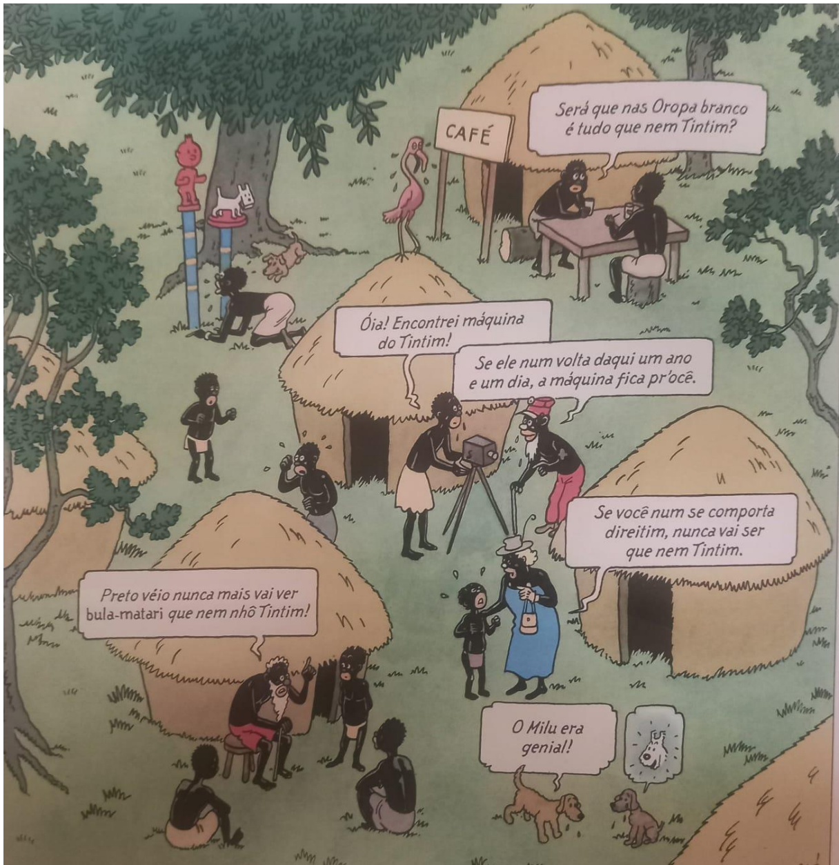
Figura 20 – Tintim e Milu são transformados em ídolos.

Fonte: Hergé, 1907-1983. Tintim no Congo (As aventuras de Tintim). 2008. p. 63.