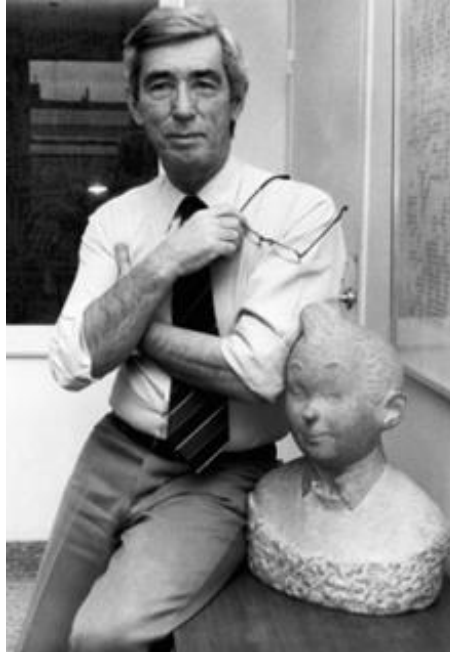
Figura 1 – Hergé ao lado do busto do Tintim