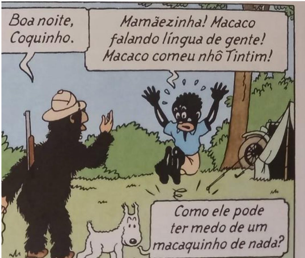
Figura 11 – Coco leva um susto com Tintim fantasiado de macaco.

Fonte: Hergé, 1907-1983. Tintim no Congo (As aventuras de Tintim). 2008. p. 18.