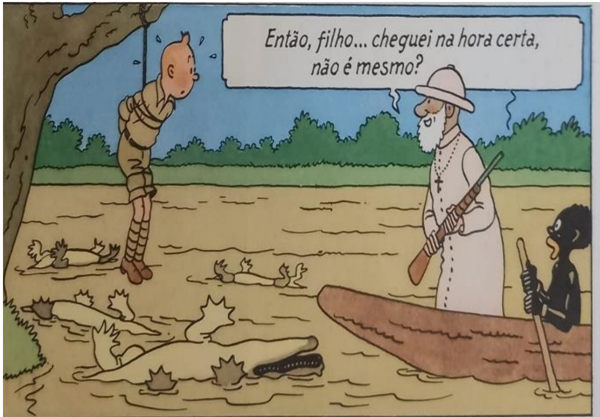
Figura 16 – Tintim é salvo pelo missionário

Fonte: Hergé, 1907-1983. Tintim no Congo (As aventuras de Tintim). 2008. p. 33.