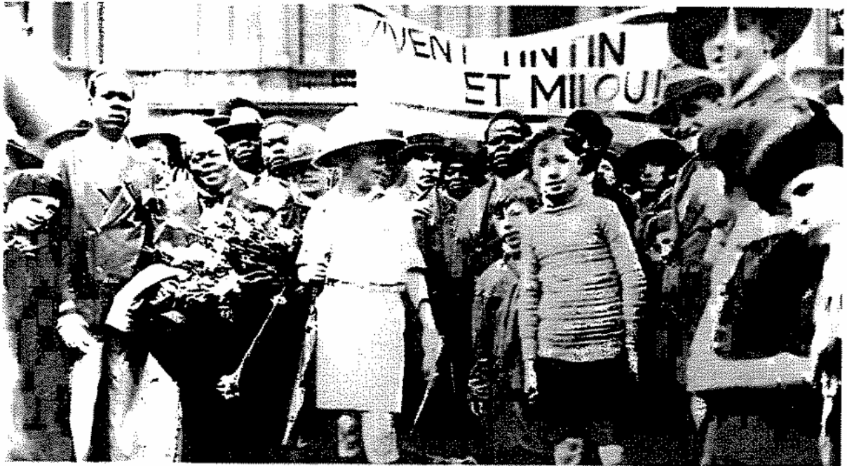
Figura 2 – Retorno do Congo belga a Bruxelas em 1931, Tintim e Milu são festejados pela multidão de seus admiradores reunidos no Petit Vintième

Fonte: Tambascia, Christiano Key. Representando o Congo: uma análise antropológica dos quadrinhos de Tintim/ Christiano Key Tambascia. Campinas, SP: [s.n], 2004. p. 72.