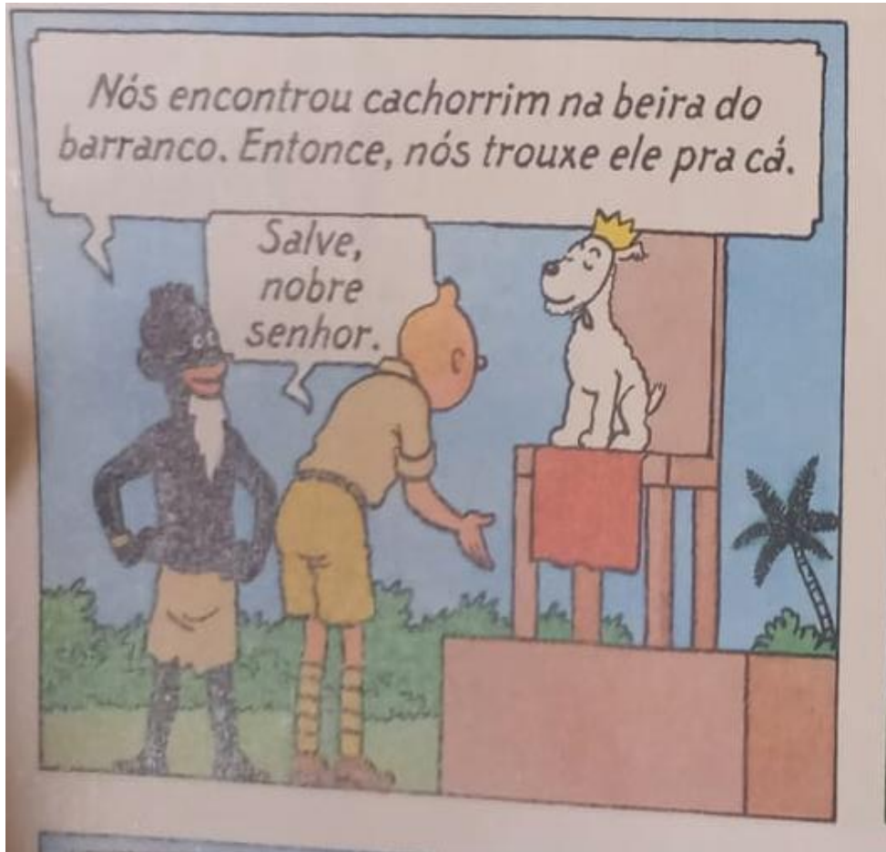
Figura 19 – Tintim curva-se ao rei Milu

Fonte: Hergé, 1907-1983. Tintim no Congo (As aventuras de Tintim). 2008. p. 50.