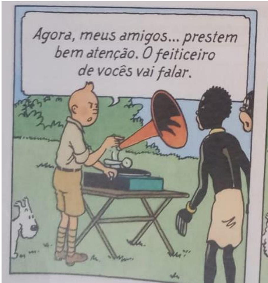
Figura 15 – Tintim no gramofone

Fonte: Hergé, 1907-1983. Tintim no Congo (As aventuras de Tintim). 2008. p. 26.