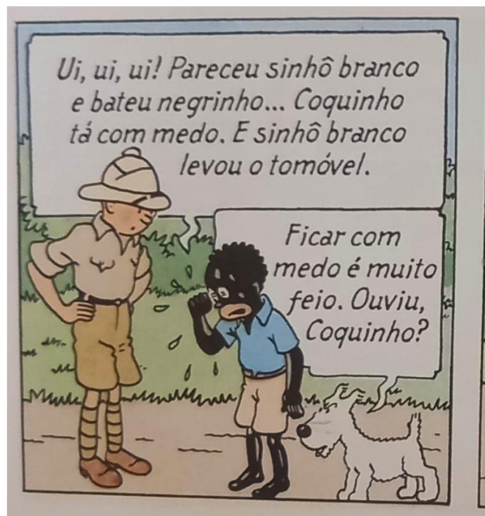
Figura 10 – Tintim conversa com Coco

Fonte: Hergé, 1907-1983. Tintim no Congo (As aventuras de Tintim). 2008. p.14.