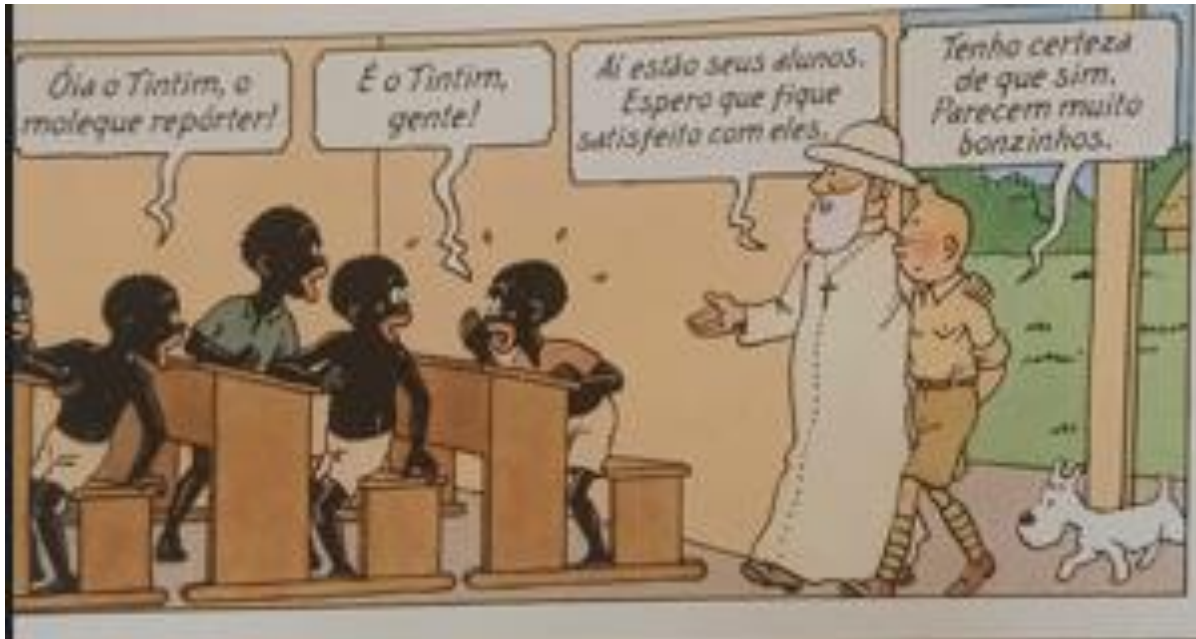
Figura 17 – Tintim entrando na sala de aula dos nativos

Fonte: Hergé, 1907-1983. Tintim no Congo (As aventuras de Tintim). 2008. p. 36.