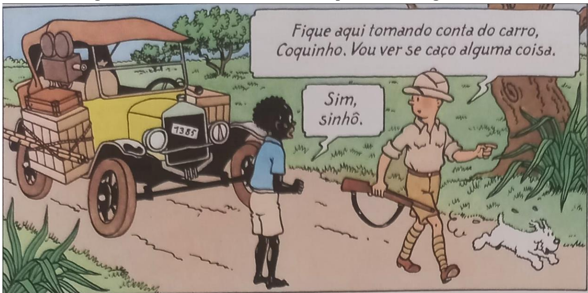
Figura 12 – Tintim dando uma ordem para o Coco vigiar o carro.

Fonte: Hergé, 1907-1983. Tintim no Congo (As aventuras de Tintim). 2008. p. 12.