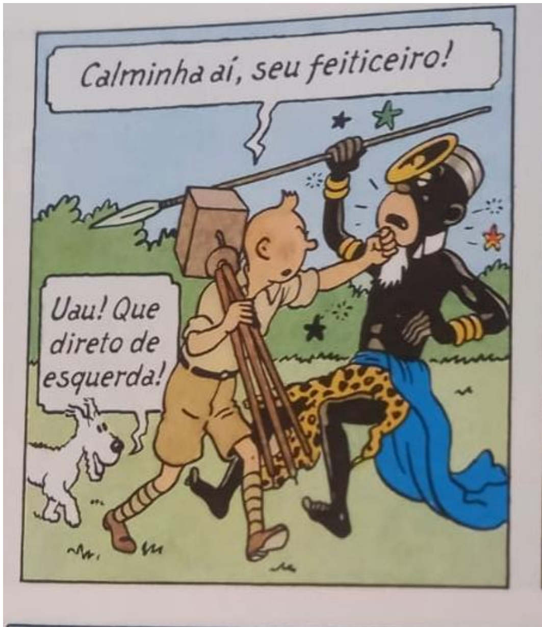
Figura 14 – Tintim derrota o feiticeiro

Fonte: Hergé, 1907-1983. Tintim no Congo (As aventuras de Tintim). 2008. p. 26.