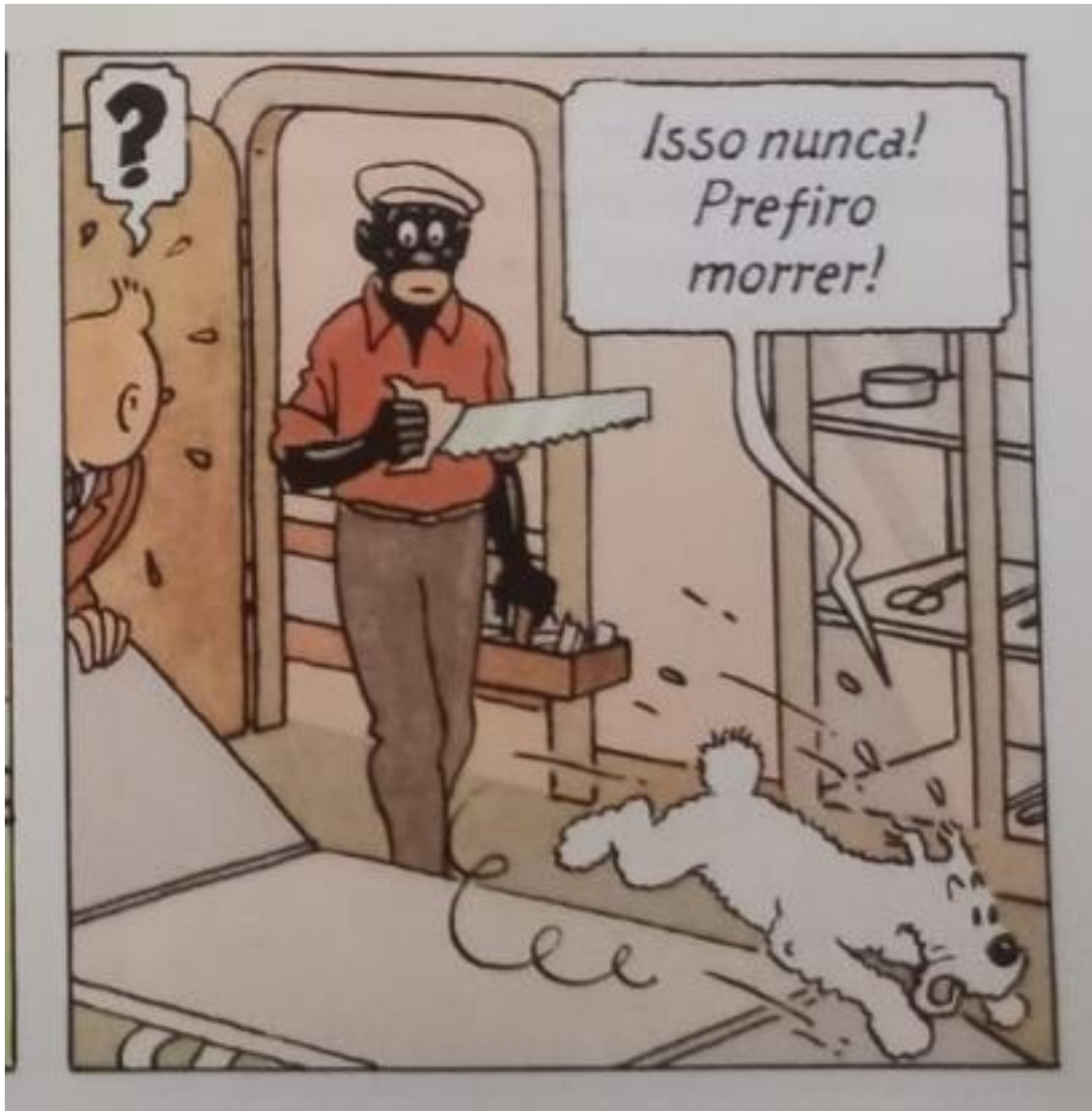
Figura 6 – Negro carrega um serrote

Fonte: Hergé, 1907-1983. Tintim no Congo (As aventuras de Tintim). 2008. p.3.