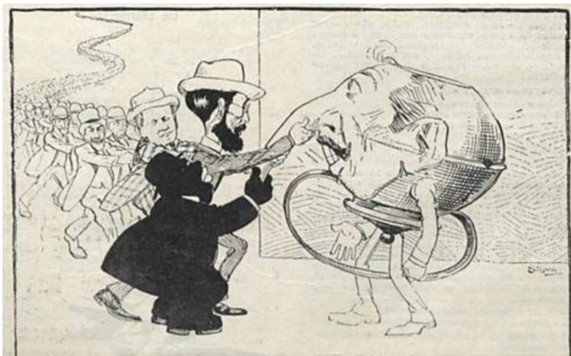
Imagem 5 – Representação de Monteiro Lopes.