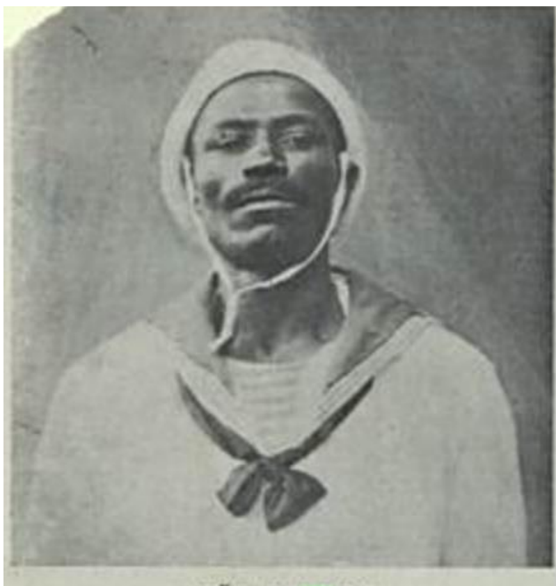
Imagem 4 – Fotografia de João Cândido.