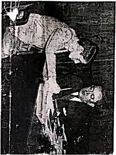
O Diretor do Colégio quando falava a "Ciências e Letras"

Lembramos aos nossos leitores que no ano passado só o Grêmio mantive o princípio, "meus são em corpo são". O Pedro II descurou-se, completamente do desenvolvimento físico de seus alunos. Nem tivemos mais as "clássicas" marchas, no Campo de Santana. Conclue a pag 6