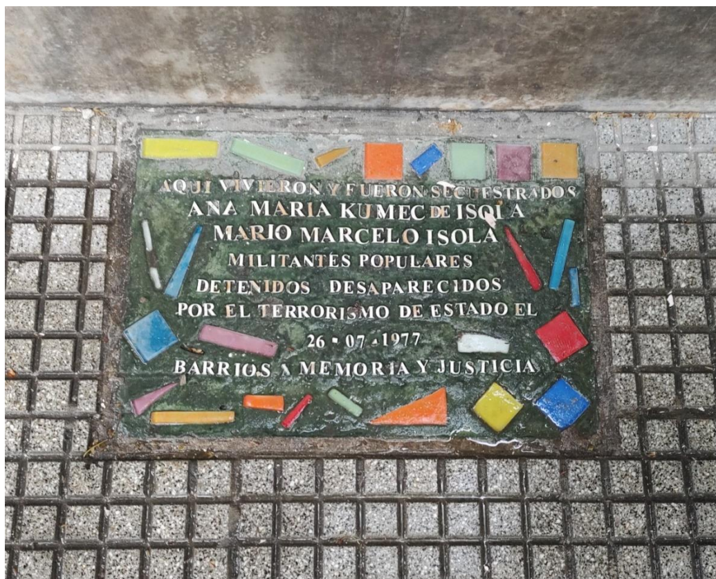
Figura 2: Fotografia de placa memorativa nas ruas de Buenos Aires.