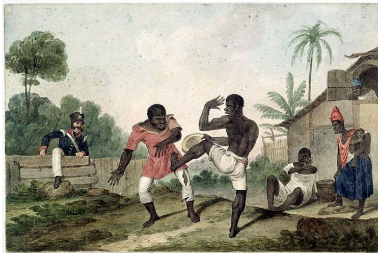
Figura 5: Quadro de Augustus Earle mostrando roda de capoeira.

Fonte: EARLE, Augustus. "Negroes Fighting, Brazil", 1824. Disponível em: http://archive.understandingslavery.com/index.php?option=com_content&view=article&id=870_slaves-fighting-brazil&catid=146_life-on-the-plantation&Itemid=256.html . Acesso em: 5 mai. 2022.