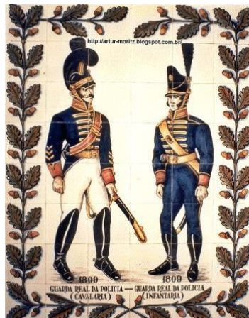
Figura 4: Slide com características da Divisão Militar da Guarda Real de Polícia da Corte.

• A Divisão Militar da Guarda Real de Polícia da Corte fazia o policiamento ostensivo da cidade.