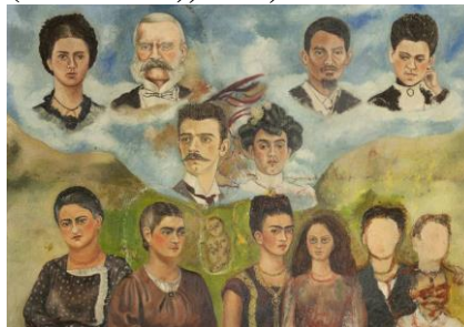
Figura 7-Retrato de Família (inacabado),1950, Frida Kahlo