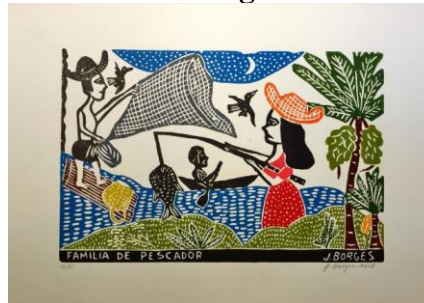
Figura 3-Família de Pescador, 2018, J.Borges