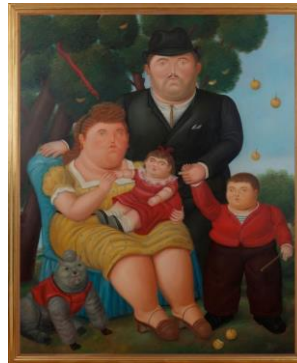
Figura 4-Una familia 1989, Fernando Botero