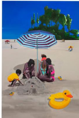
Figura 5-Sem título, 2021, No Martins