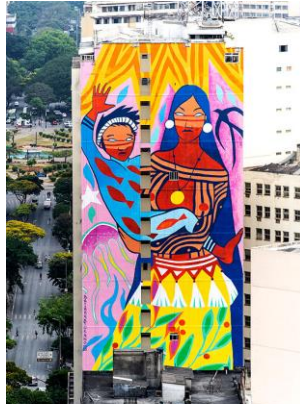
Figura 6-Selva Mãe do Rio Menino, 2021, Daiara Tukano