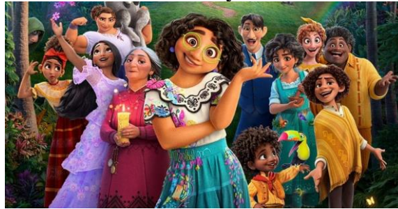
Figura 8-Familia Madrigal, 2021, Encanto – Disney