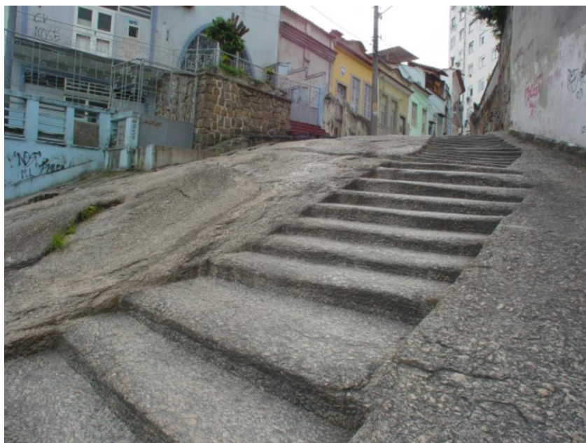
FIGURA 4: Pedra do Sal, Morro da Conceição

FONTE: Agência Brasil/ Arquivo. Disponível em: https://agenciabrasil.ebc.com.br/cultura/noticia/2014-11/rio-comemora-os-30-anos-da-pedra-do-sal-como-patrimonio-tombado . Acesso em 20/02/2020.