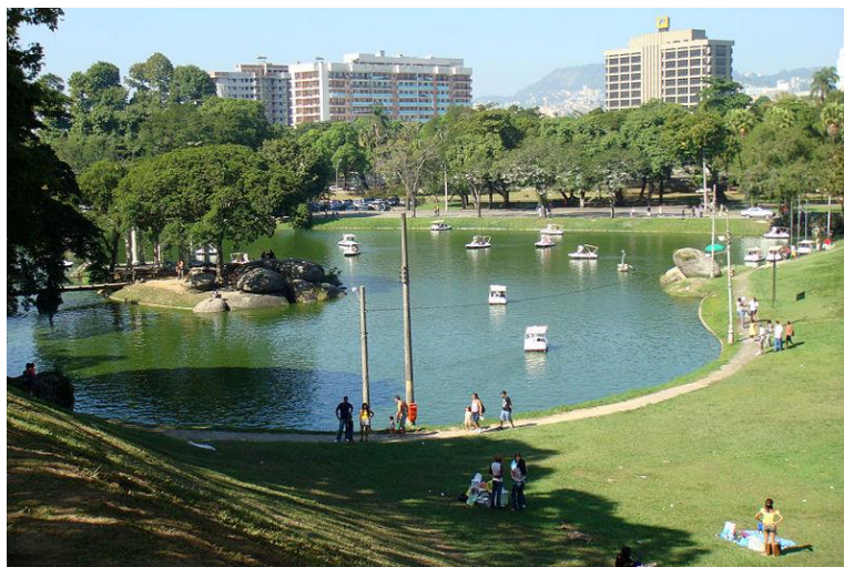
FIGURA 1: Quinta da Boa Vista.