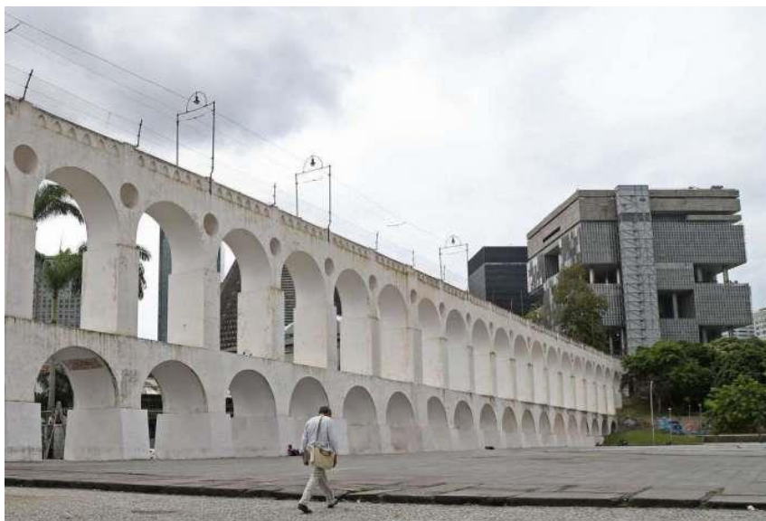
FIGURA 5: Os Arcos da Lapa, Região Central