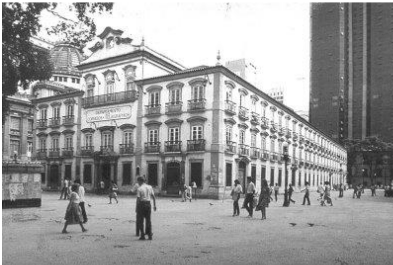
FIGURA 6: O Paço Imperial