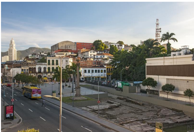
FIGURA 3: Sítio Arqueológico Cais do Valongo